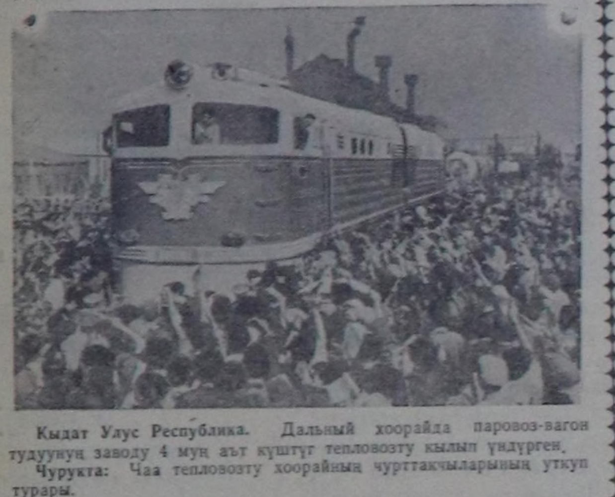
Кыдат Улус Республикасы. Дыйын хоорайда паровоз-вагон тудууну заводу. 4 муң аяк күштүгү тепловозу кымыл үндүргөн. Чурукта: Чаа тепловозу хоорайына чурттакчыларынын уктуу турары.

Профвизиллердин Бүгү-делегей Федерациясынын чингине секретары Луи Сайянга „Улустар аразында тайбынны быжыглаары дээш“ делегейин Ленинчи шаанналын тывыскан. Сөөлү ийи чылдарда сүт бугулары колхозга элэн көндүр. Бо чылы колхозтун бир инектен сагган сүтү, эртең чылдың бо үезинде дөмөйлөргө 132 килограмм көндүр, ооң түнелинде колхоз сүт бугуларынын болгаш күрүгөсү сүт дүмүрүнүн лашын күтсөткөн.