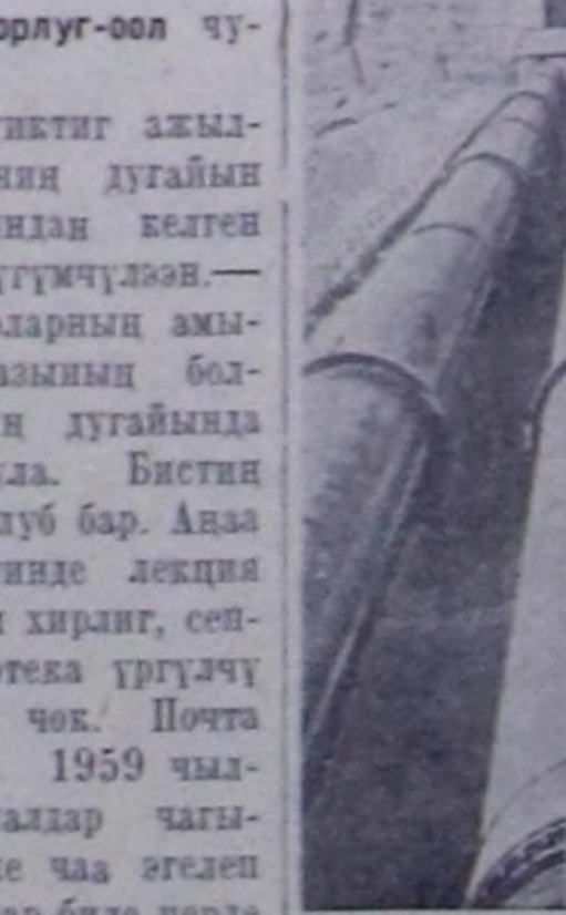
Чурунта: ГЭС турбиназыңче Тере-көмөл 160 метр бедиңтен суг агып турар хоолой.