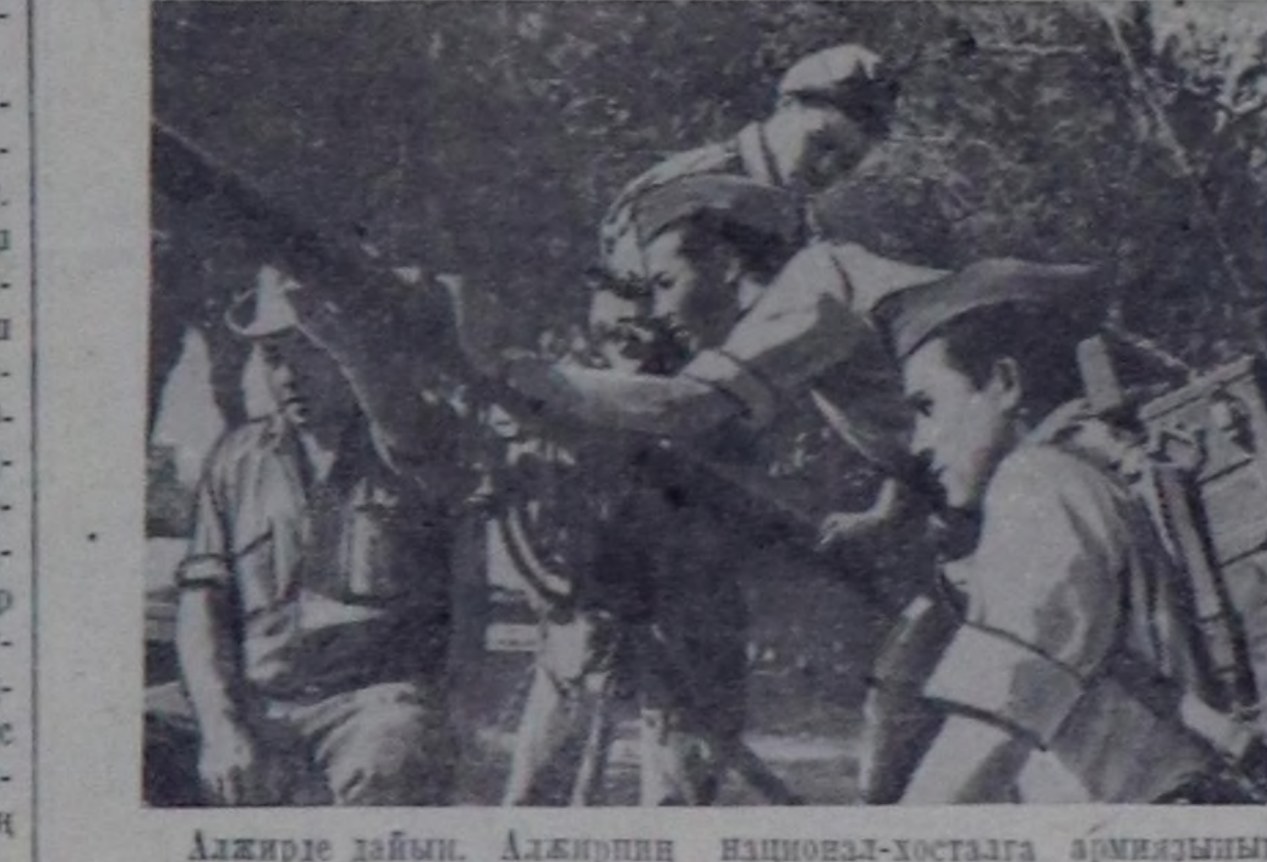
Алжирде дайын. Алжирин национал-хостага армиязынын дайынчылары дайынчы техниканы шитиндерип ал туралды.

ПАРИЖ. (СЭТА). 1956 чылда француз эрге-чагыргаларга өөр өзү-биле туттурган болган ам Фран-цияда кара-бахында чымар Бен Белла болган Алжир республиканың түр чазанын өскө-да жекигуулары оларын кеземче керектери үгүлө-көпөр шынап кылдыр аажалып турарына удурланышкынын демдээ кылдыр чартык ай шитинде чөк чөйвөй, аш чарлап келгенер. Парзалага мөдөлөрен өзүгээр алыр-га, француз кара-бахында чымар Алжирин «хостаарынын национал фронтунуң бүтү удуучуларын плантыка талзы-биле коругат-тырганнарың өзү-чүрүмүнө шал-чиптын шаанд олар аш чарлаш-кынын көскөткөс деп шитиндерип алганар.