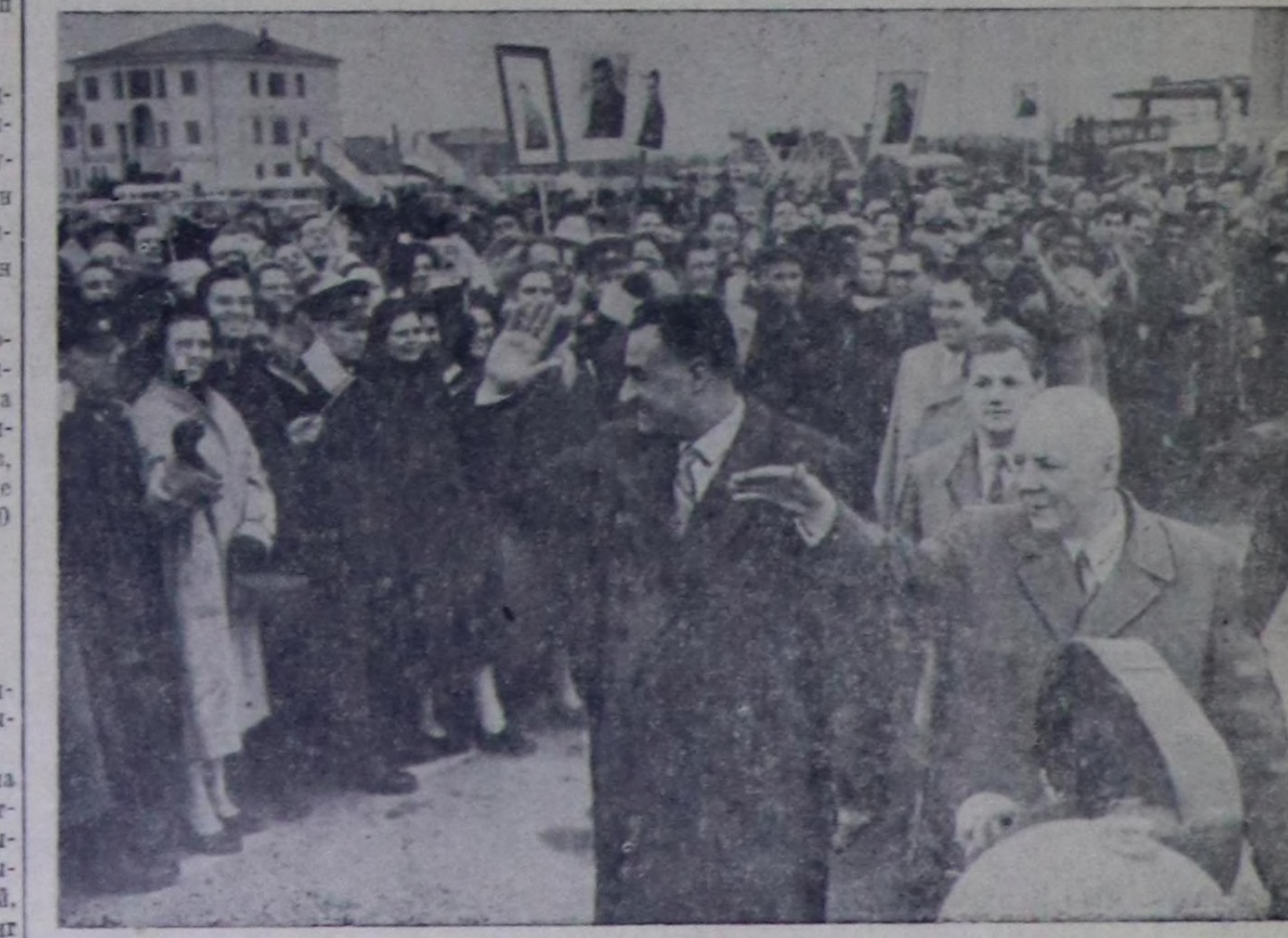
Каттышкан Араб Республиканың Президентизи Гамаль Абдель Насер Москвага келгеш, К. Е. Ворошилов-биле кады чоруп турда, москвалыкларын байыр чедирип турары.