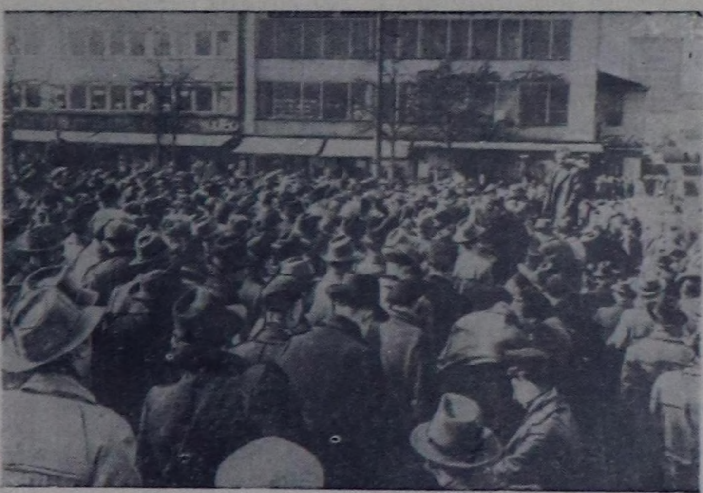
Германияны Федеративтиг Республиканы агтмнуг чепсек-биле чепселгелерини планына удуз Кассель хоорайга чыскаал болган. Чурукта: чыскаалга киришкен ажилчыларын митингини.