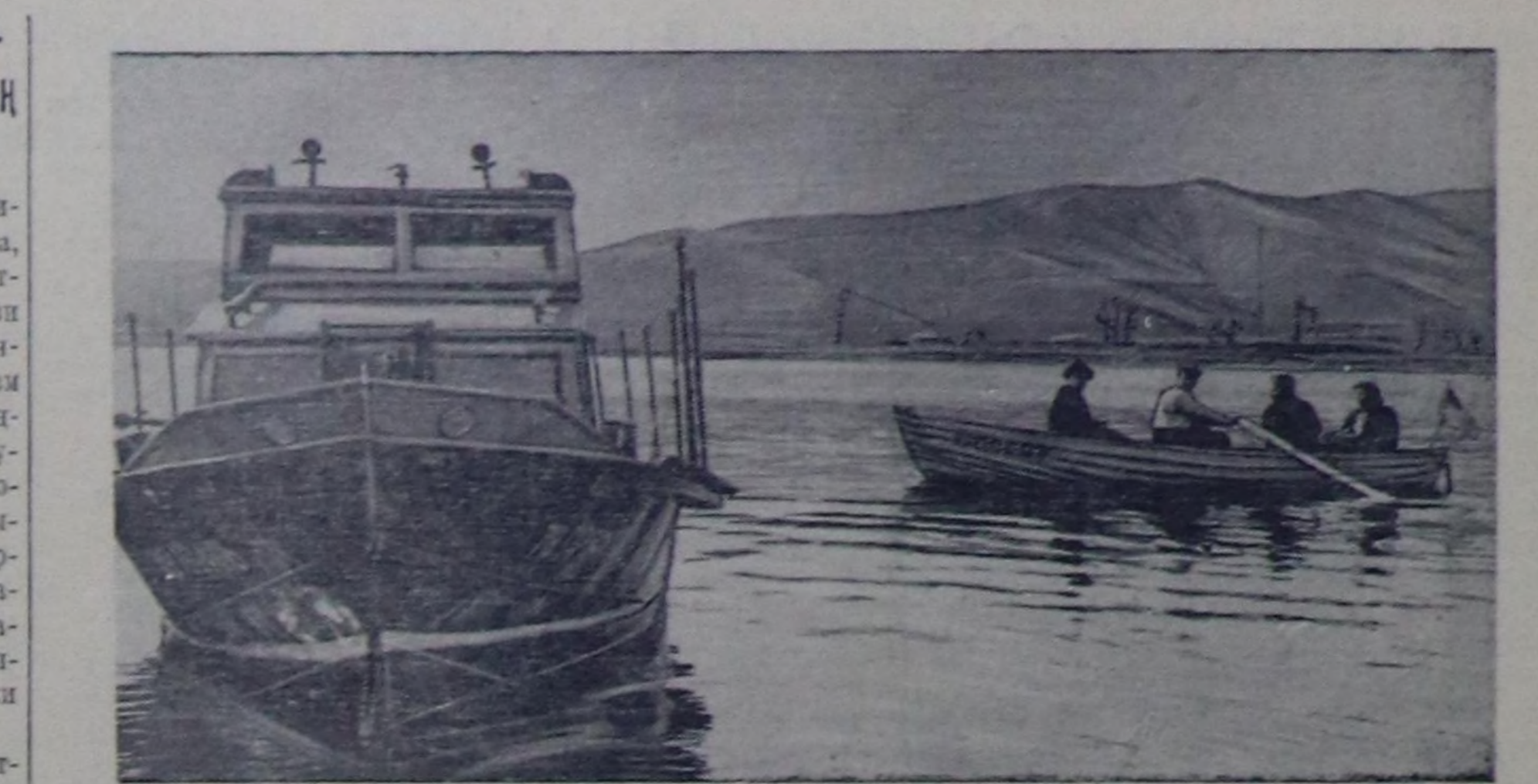
Улуг-Хемде селгүстөшкөн.

Шуф районда боолажымышкынар үргүчүлөп турар. «Инда аль-Ватан» солунуң дыңатканында алдыга, ажил соксадымышкыныры болгаш тура-халыкчыларынч чөпсектиг тулачушкуннары чурттуң оске-даа районнарында база болуп турар.