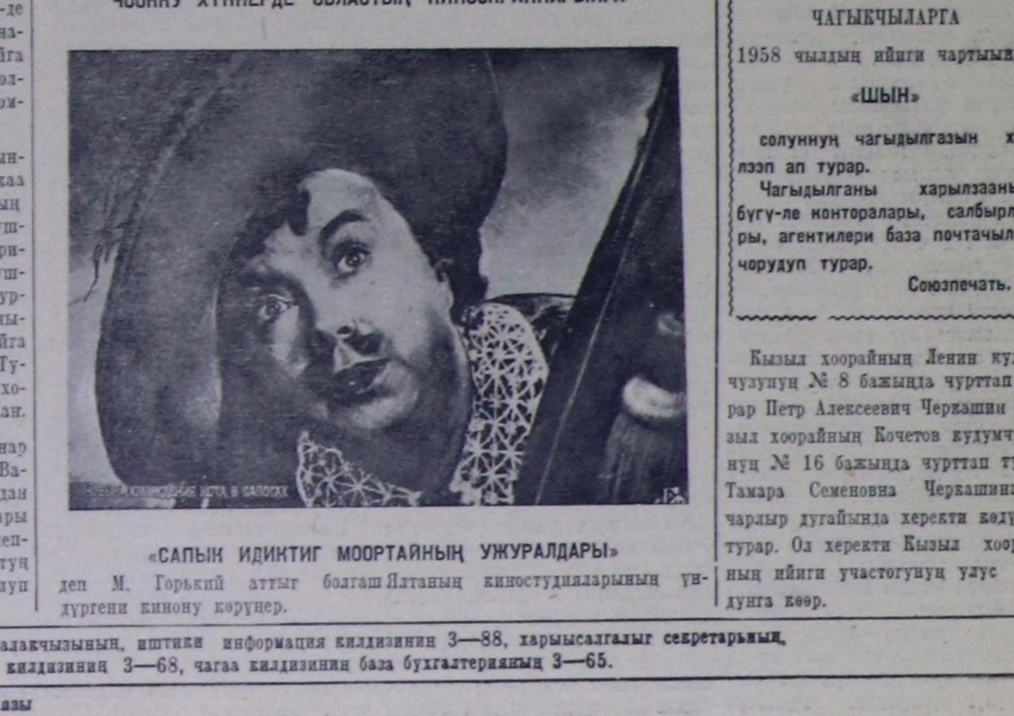
«САПЫН ИДИНТИГ МООРТАЙНЫ УЖУРАЛДАРЫ» деп М. Горький аттыг болгаш Ятаның киностудияларынч үндүргөн кинону көргөн.

ЧОККУ ХУННЕРДЕ ОБЛАСТЫҢ КИНОЭКРАННАРЫНГА