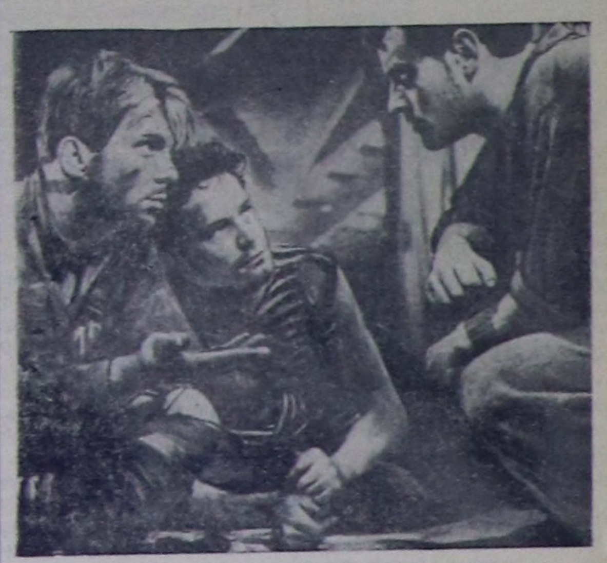
«РИТА» деп киноу көрүдөр.