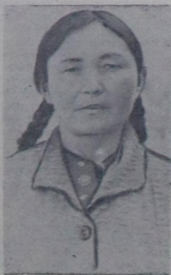
О. ЧИМБИЯ. Каа-Хем районунун Ленин аттыг колхозунун саанчызы.