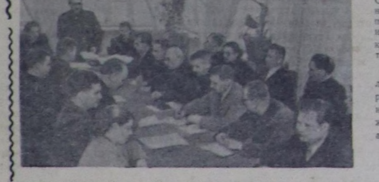
Тернополь область. Трёмбовлянский партия райкому районун колхозтарында партия организастызынын бирги секретарларынын семинарны доктаамал чорудуп турар. Семинарнын киржиликчелери партиянын болгаш аныктыг чугула шийтирлерин өөренип, партия ажылынын таламы-биле дуржула солучууну кылып, лекцияларын диньнап турарлар.

СЭКП Чөөн-Хемчик районунун организастызынын эржектежин.