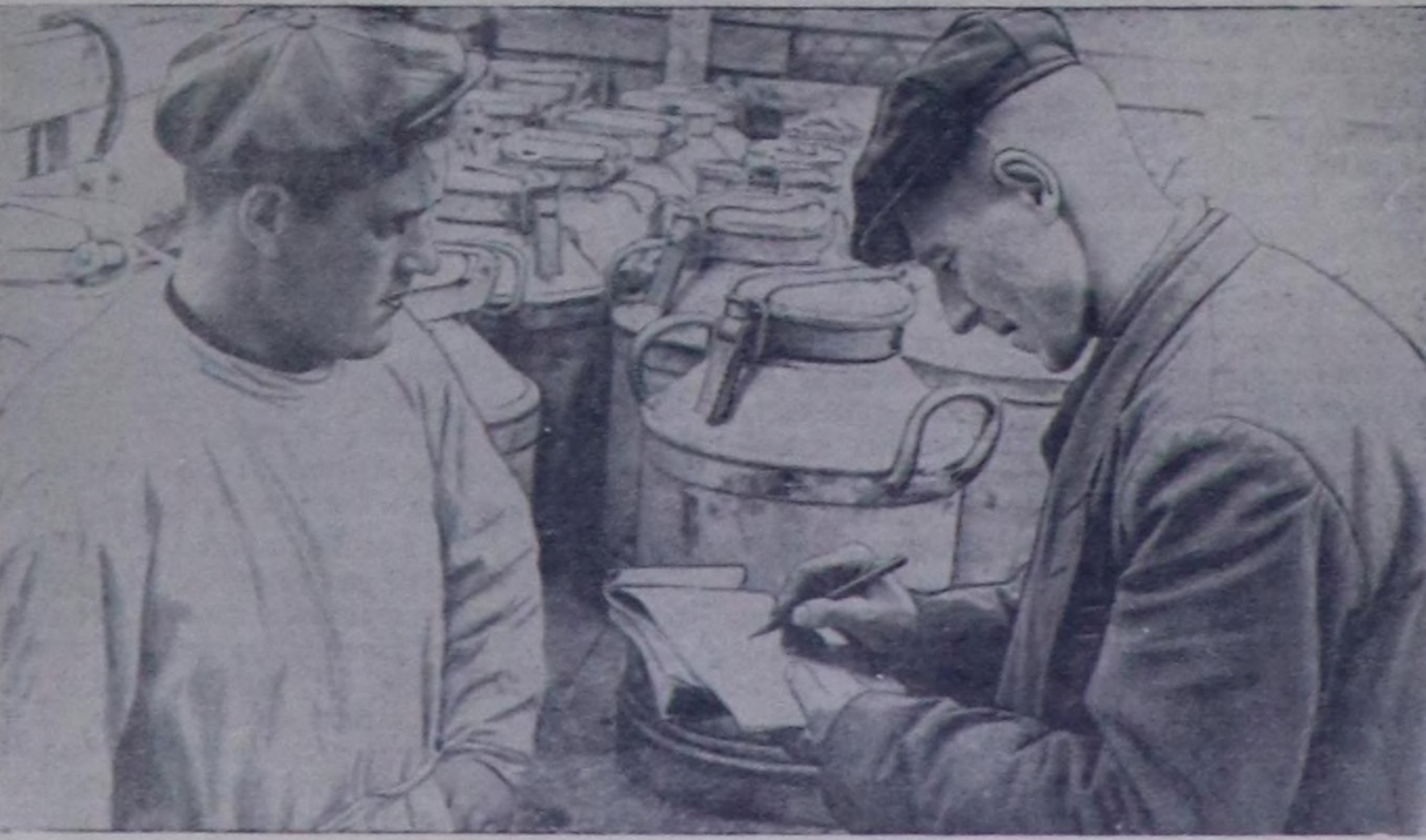
«Элегес» совхоз Кызыл хоорайның эмнеге черлерин, уруглар ислизери болгаш салтарын база хоорайның чурттакчы чонун хандыраары-биле хүнүн-не 1200 кг сүттү болгаш ак саржагны хоорайже чорудуп турар. Чурунта: хоорайже кйрер сүттү түзөдип берил турары.