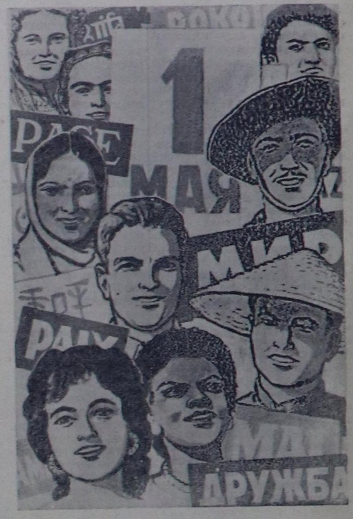
Тайбың болгаш найырал.

Чажыт маевдан бүгү кижилеринче холдарывыс сунуп тур бис. Улустарны дарлап турар чепселеншиктерниң үүрүзүн ништи күштер-биле ап октаптаалы! Дайынның, өлүмүнүң болгаш узуткайшыкының кыжанышыкындан делегейни хостаалы! Депшилгеже бар чоруур кижиги төрөлгетениң чырыкылыг болгаш аас-кежиктиг келир үези бистерниң мурнувуста, Делегейге тайбың! (Тайбынның Манифезинден)