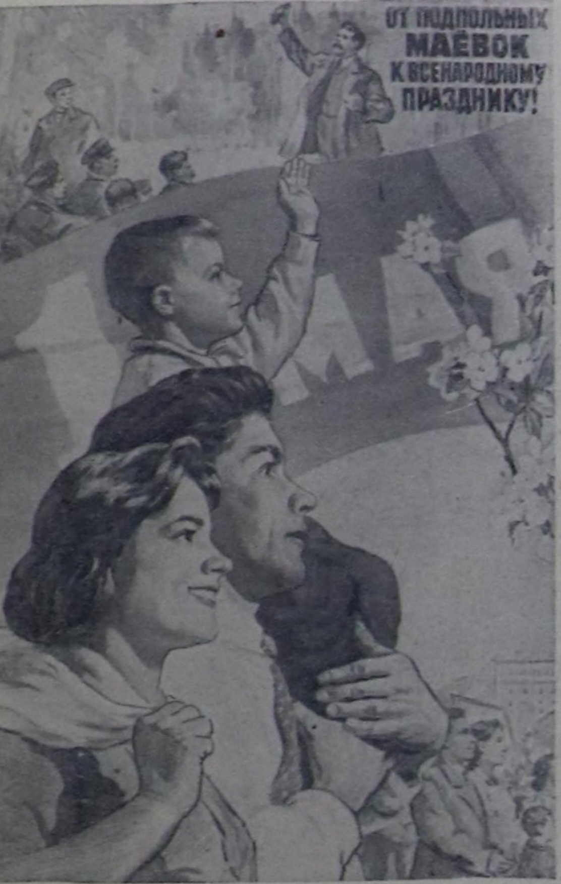
Чажыт маевдан бүгү улустуң байырлаамыга чедир.

Тергиндекчи ангылар Коммунистиг Революциянын мурнунга сиргайнып турзунар. Пролетарийлер боттарынын кинизинден өске аңаа чидирер чүези чок... Бүгү чурттарнын пролетарийлери, каттыжынар! (Коммунистиг партияның манифезинден)