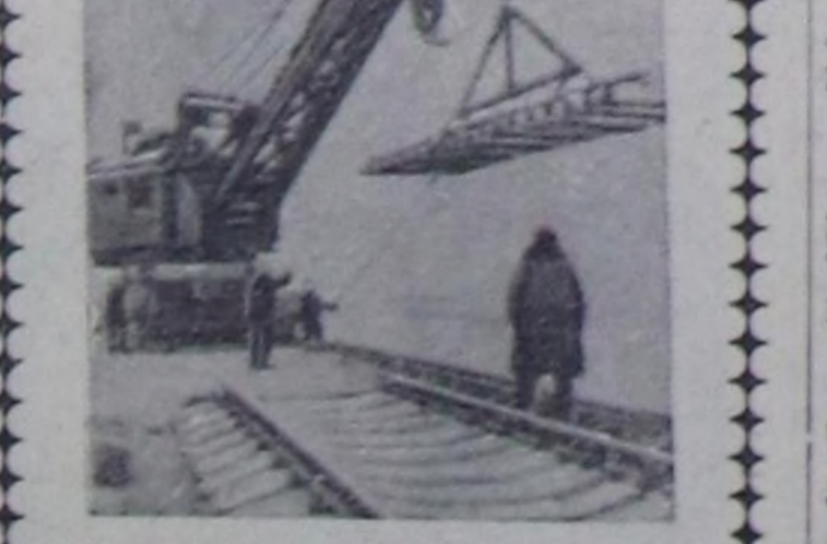
Кыдат Улуз Республика. 1100 километр узун дүрттүг Баотоу—Лянжоу демир орук шугуму турарына ышкыш материалдарын камнаары-биле демир-бетон шпалларын ажылга турар. Бо чылдын төңүрүдө поездилер чоруп эгелээр.

Даразындагы сески салышык март 25-те болган.