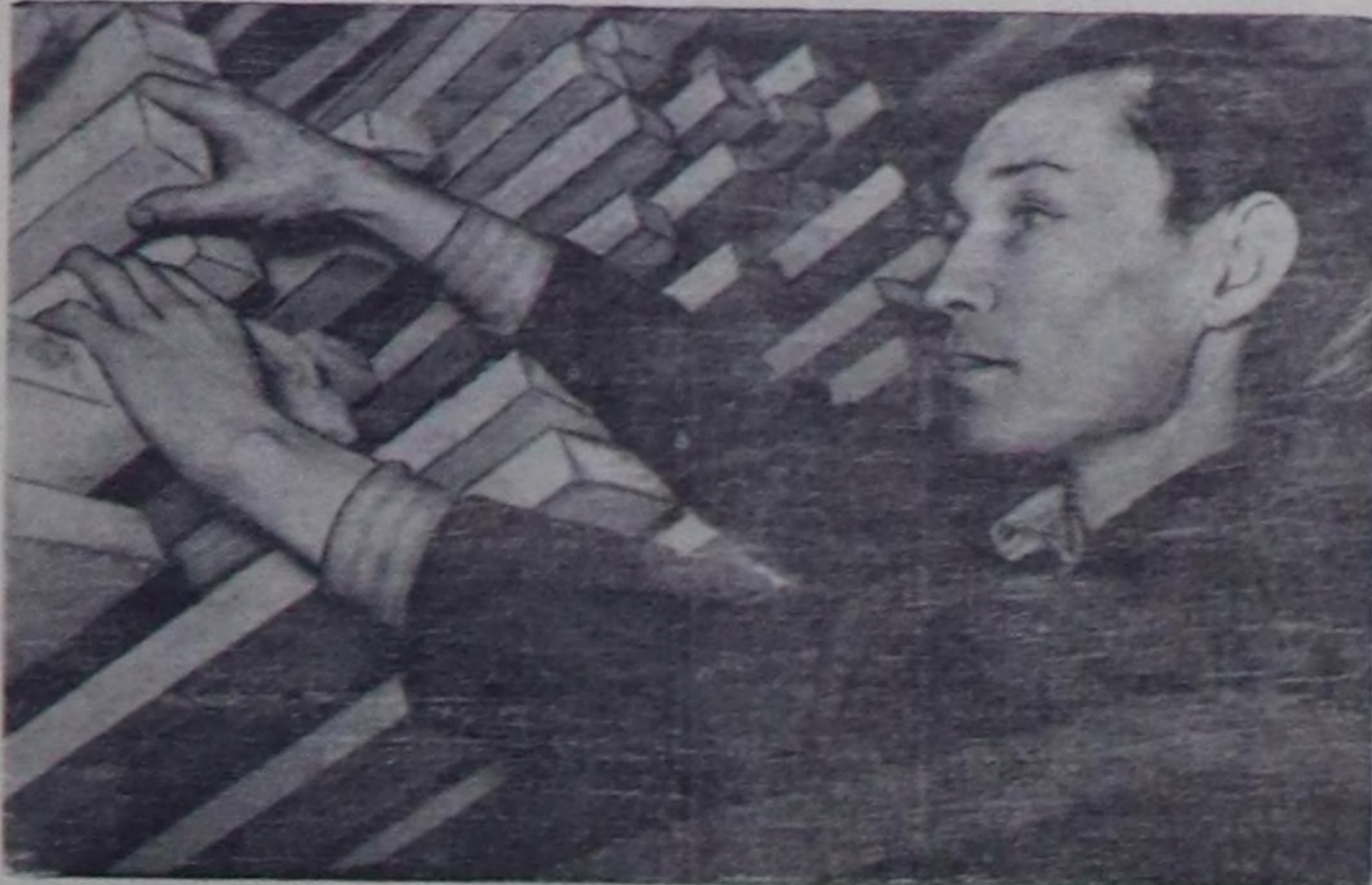
Сарыг-Септич улетири комбинатынын муракчы ажылчыны эш С. Калында илген иштарын хынап, сортуунда турары.

Болхостун тудуг бртгаласы 1700 кубометр ыш белеткелер планында 120 кубометрини кезип белеткөөш, 1000 кубометрини машина оруунда үндүргөн. Сөөрттүкчүлөр Дөтле, Бабуу, Садывал, Эник-оол олар хун онааларын 200 хуу күтүүдөн турар. Кестинген илангыя сөөрттүгелени чоокку хүнерде доозор дөш сөөрттүкчүлөр бүгү хемчекчи ап турарлар.