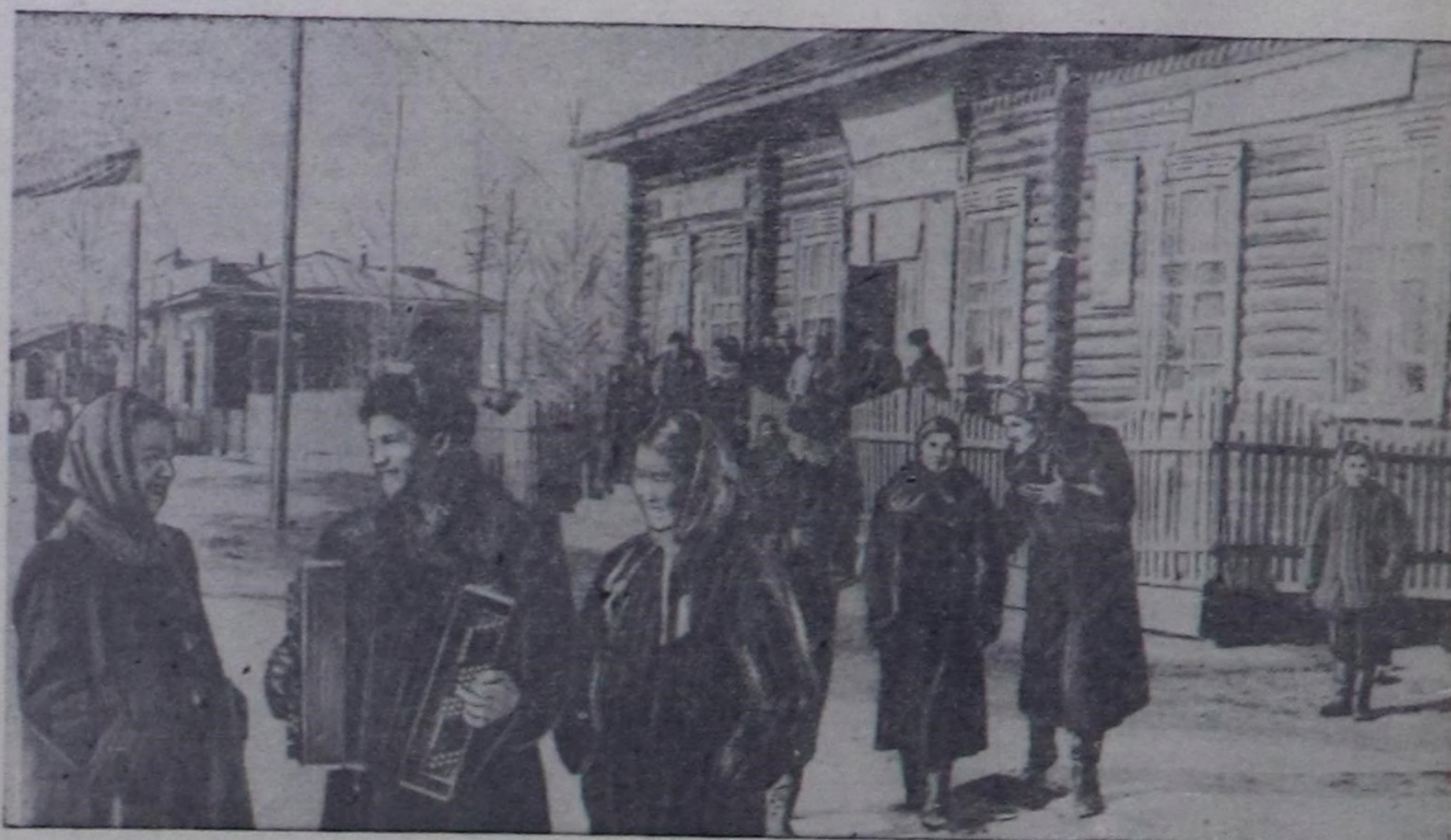
Чурукта: Чадаананын соңгулда округунда анямкатарын ойнап хөглөп турары.