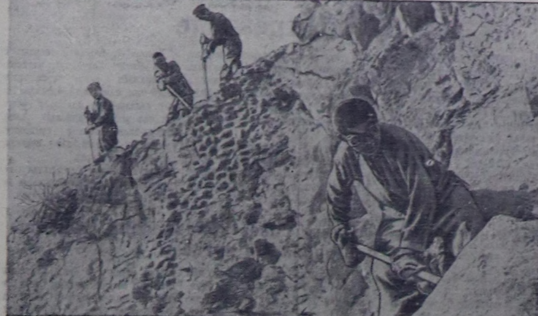
Чурукта: дашчылар бригаданын кижигүнерини ажылдап турары.

Даг дүгүн кызып тывар ажылды чорудушкан, «Тыва даг дүгү» комбинаттын тудуун ийи эгелеч-биле бир кудумчуу.