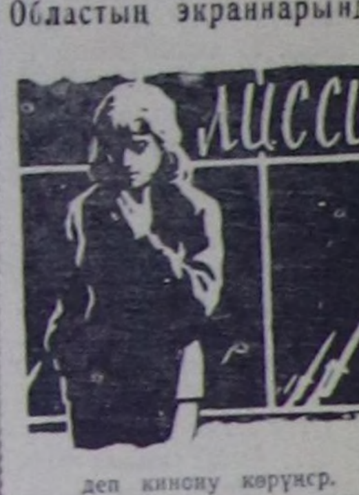
деп кинону көрүср.