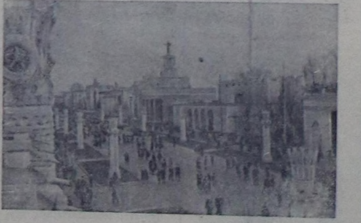
МОСКВА. Бүгү-эвиледин көдө ажыл-агый делгелгези (1958 чылаа). Чурукта: делгелгезиң девискээринде.

Чепсегленишкенин дүжүрө болгаш улустар аразынга кады ажылдажылга дээш демисежип турар. Чуртка июнь 1-ден 8-ке чедир болуп өрткөн «Тайбынның веделинге» чоңуң калбак кезектери киришкен. Москваның бүдүрүлгөсү болгаш албан черлеринге бол-гулаан хөй кижилер митингилер-ниң киркиччилери Стокгольмга бо-лур конгресини шүүт деткириңиң дугайың медеткеленер.