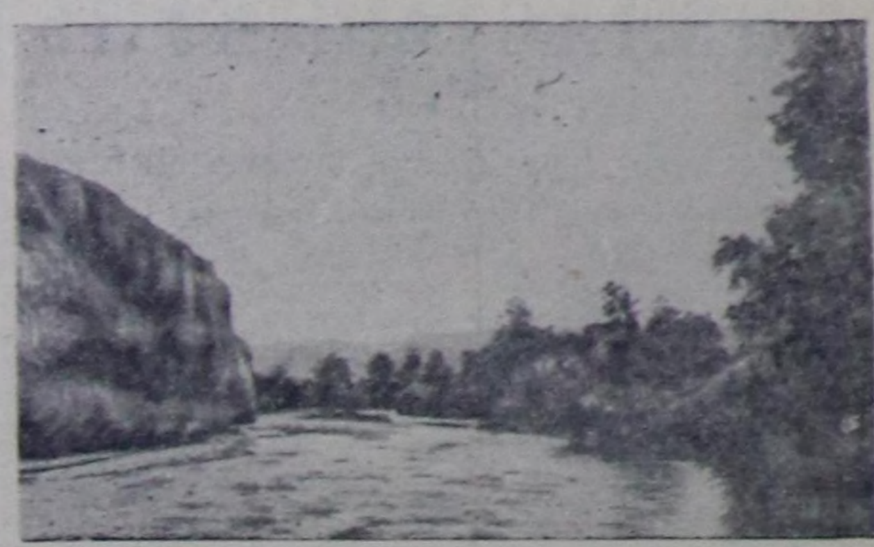
Семчиз уну.

Тыва областың Санитар-чырыдышкын бажыны.