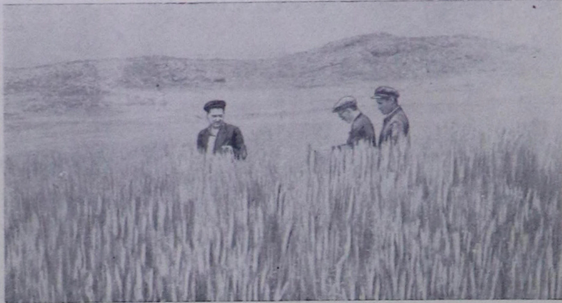
Чаа-Хал районун «Тиндешке» колхозу ажыл-агый артелинин Эрэн-Тейде кызыл-тазынын унужу дыка чагаай болгаш удаага бжык четкен. Бо чылын кызыл-тастын га буртузден 22 центнерден өрү дуктү ажаал аларын таравжылар бодал турар. Чурукта: колхозтун тарылга шөлүнде кызыл-тас.