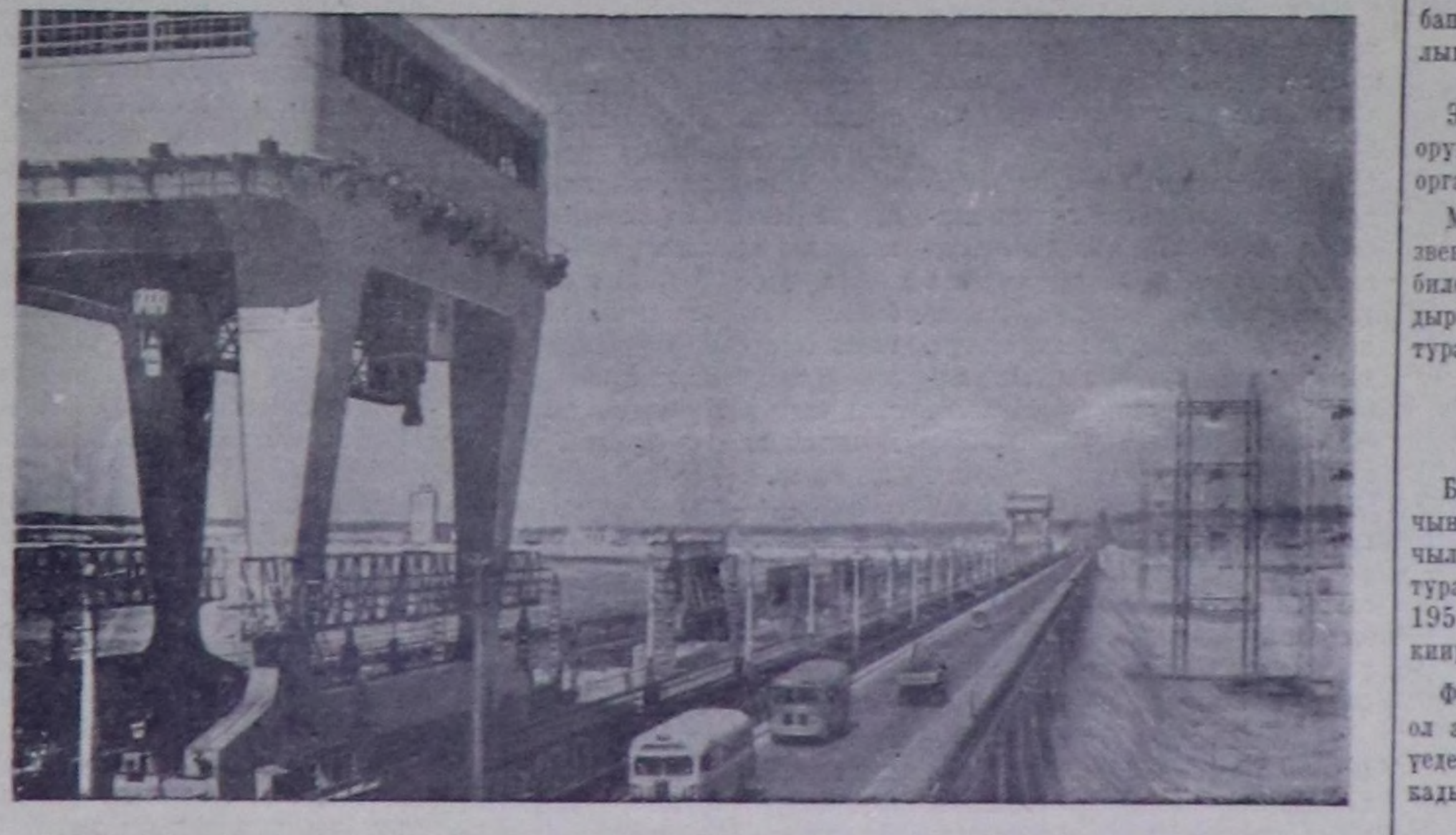
Куйбышевтин гидроудуунда. Куйбышевтин гидро-белдиринин платиназын дамчыштыр доктаамал автобус шимчээниң эгелээ. Чурукта: Куйбышевтин гидробелдиринин платина-зында автобурун.

чуртка аас-кежиңит аян-чорукту кыллары олара күзөөн. А. Новотный хармы сөс чугаалаан. Совет Эвилелинин Коммунисттик партиязынын Төп Комитетинин Президиумунун кежиңүүнүге каалды болгаш ТК-ның секретары П. И. Поспелов, ССРЭ-ниң Дээди Сөвединиң Президиумунун Дагазының оравачызы М. П. Тарасов болгаш оон-даа өскөкөп аалачыларын аян-чорукка үлөп чорурлар.