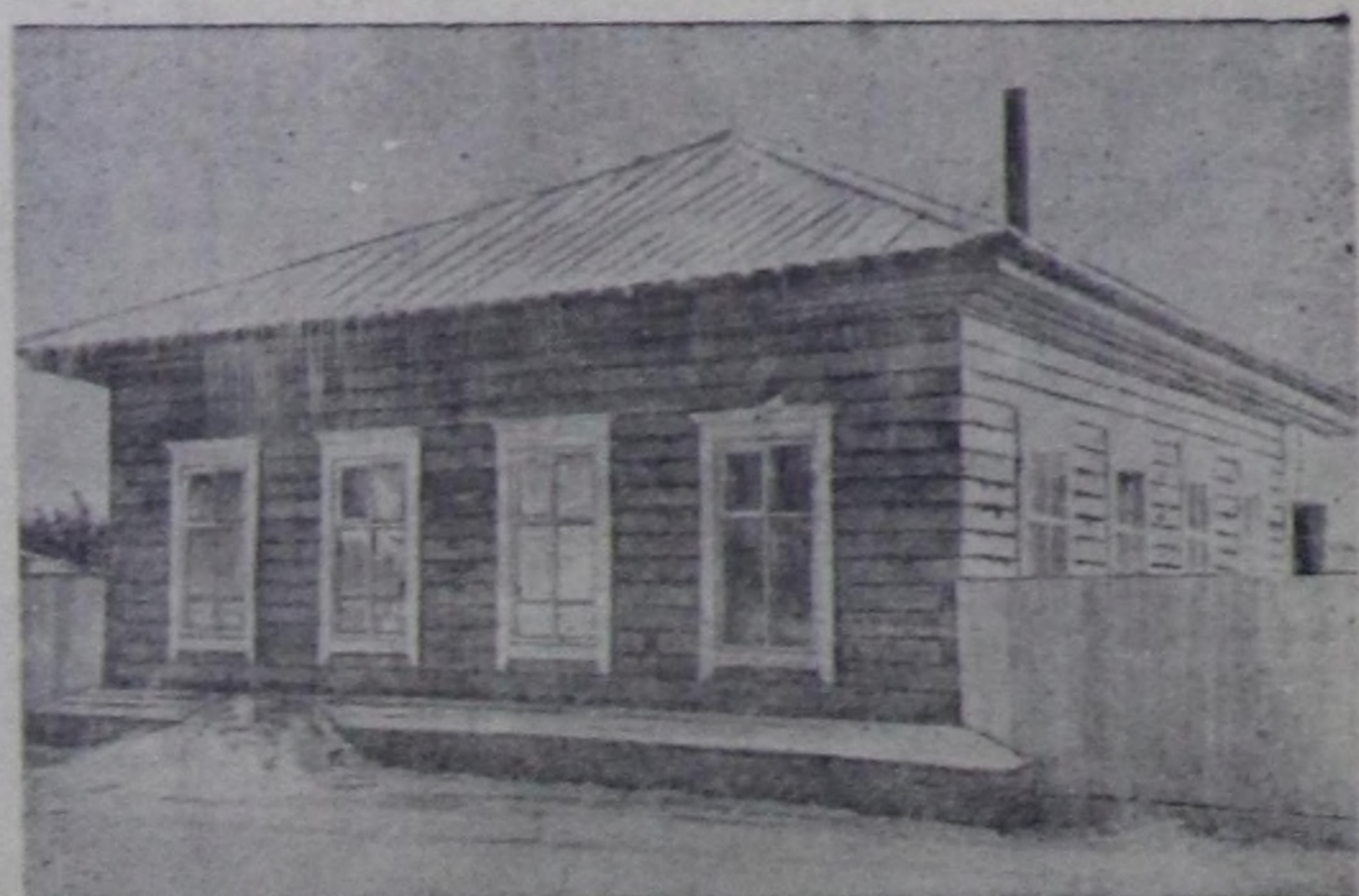
Ажилчы чонундун культурага байдалын улам өкшөөдөсүнө Самгалдай стурда чуртталгында культура-амгыларын болган эске-даа туугуларын хуушуп турар. Чөкчөк чаш өш дераттинген болган орун дөшөк-биле бүртүгү хандыртылган гостинданын туугу доошуган. Ол-ла гостинида парикмахер-саваны база тургустан.

Чурукта: чаа гостинида бакчынын чаа көдөрү.