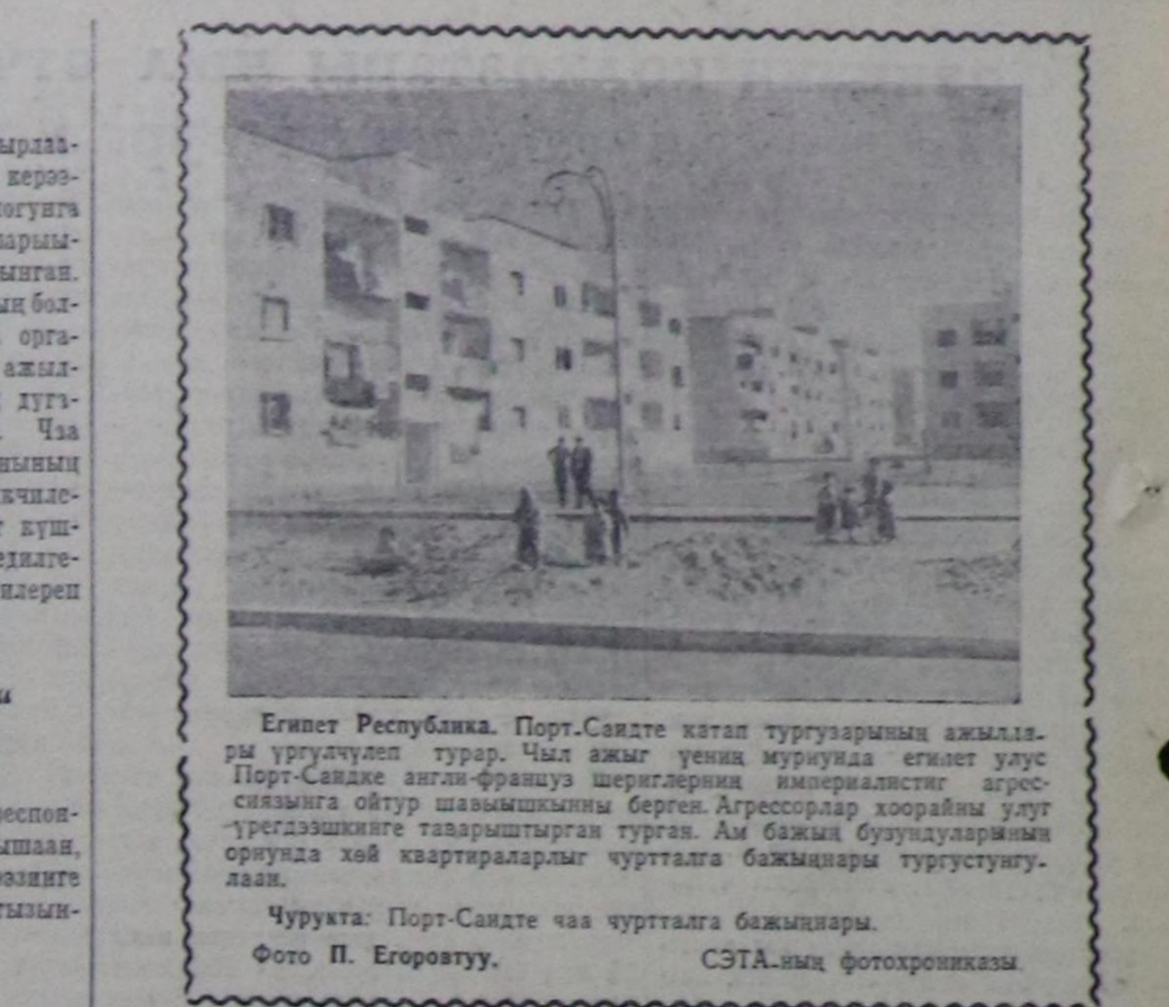
Египет Республика. Порт-Саидте катар туртузганы амылчылар урулдулуп турар. Чыл амыл үениң мурунда египет улус Порт-Саидке англи-француз шериглерин империалисттик агрессианыга ойтур шакышыкыны берген. Агрессорлар коорайын улусту үргөдөшкөнге таарыштырган турган. Ам бажы бугуруларны ооруанда хөй квартиралардыг чурутталга бажынары тургустунулаан.