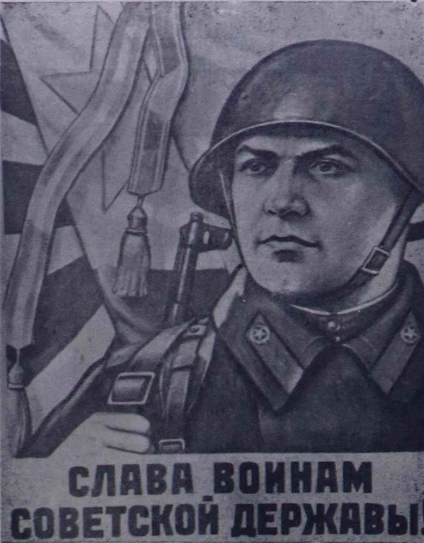
СЛАВА ВОИНАМ СОВЕТСКОЙ ДЕРЖАВЫ!