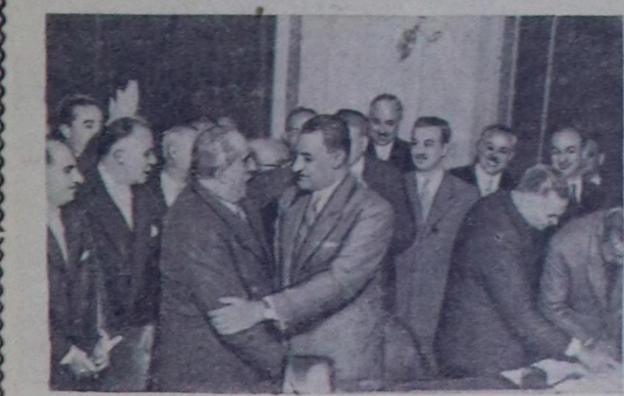
ЕГИПЕТ. Чоокта чаа Баирге, Египет Республиканы президентиниң орудуңга Баттышкан араб республиканың Делегациясыңга ат салдынган.

Францияның Коммунист партияның парламент бөлүгүнүң даргазы Жан Дюво Национал хуралды хуралыга чүве чугаалааң, француз конституцияны өскө дээр реалсыг орадакчышкынарың шынтыг шүгүчүлөөн.