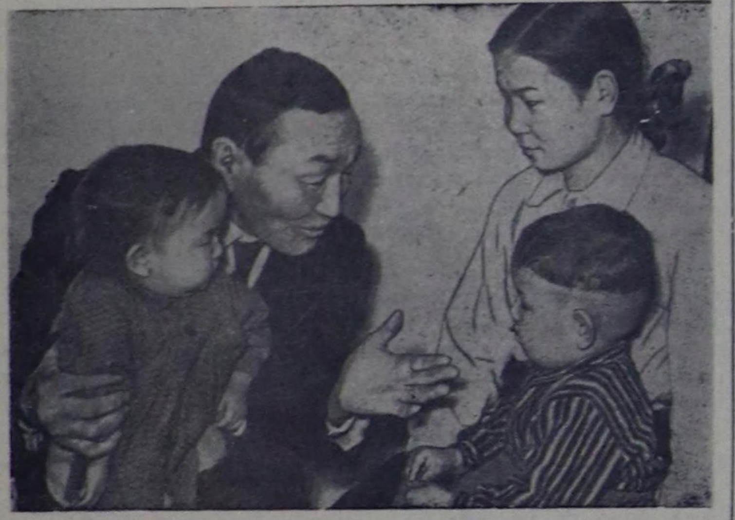
1918 — 1919 — 1920 чылдарда Тывага болган хамааты дайынның киржикчи, ам Танды районун Державинский аттыг колхозтун колхозчуу С. Т. Билгир бодунун уругларының уругларына шаандакы дайынчы ачыл-чорудулазымың дугайында сактымыкының чүтаалап берип олурум.