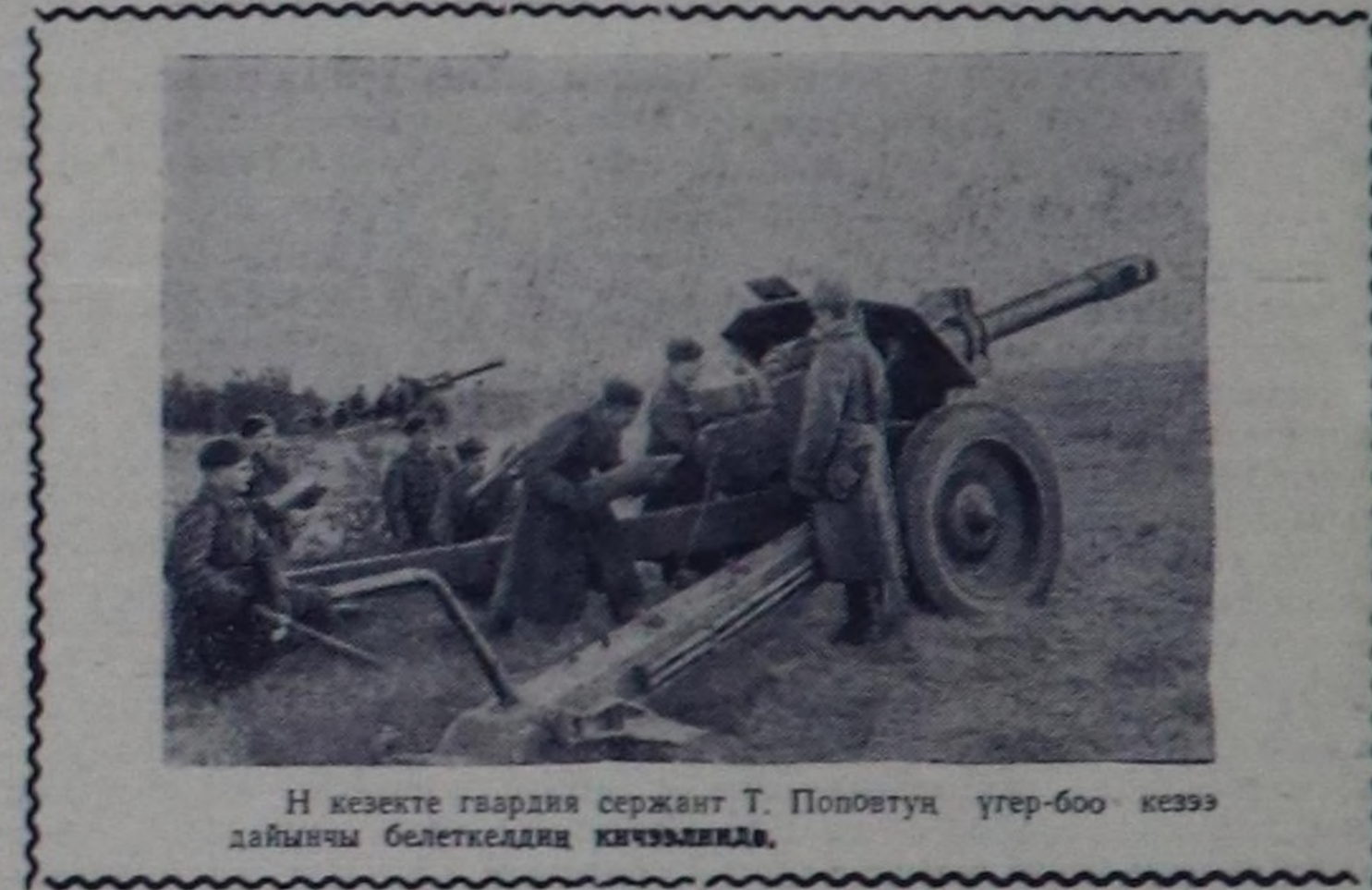
Н кезекте гвардия сержант Т. Поповтун үтөр-бөө кезээ дайынчы белекелдиң кичээлде.