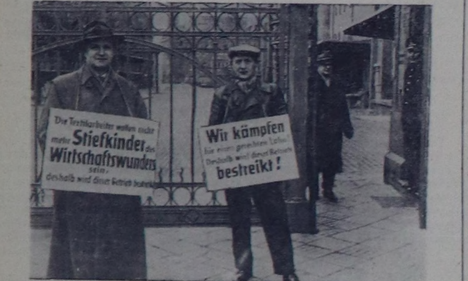
Германияның Федеративтик Республикасы. Бремен, Бремерсхафен, Делменхорст болгаш Ганноверда хоорайларда 7 чус муң пос-тавазы ажалчылары ажал төлөвирин улдаттырарын негеш ажал соксаткан. Чуртту: боттарының негелдесин бижип алган ажалчыларың завод ажинде турары.