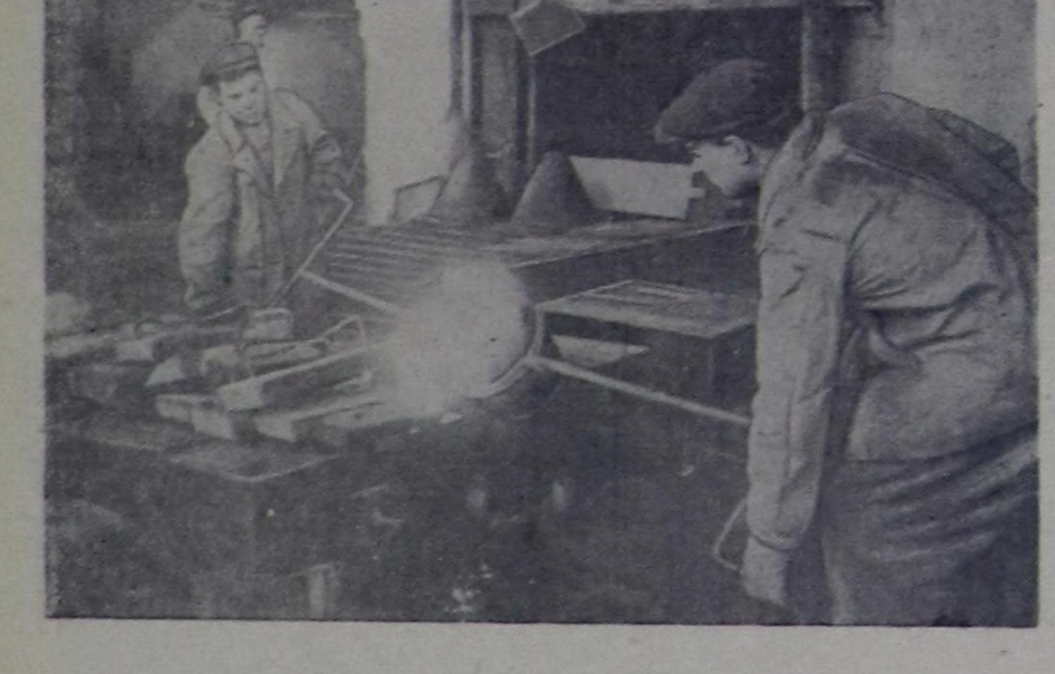
Чурунта: Заводтун шуткулга цехи.