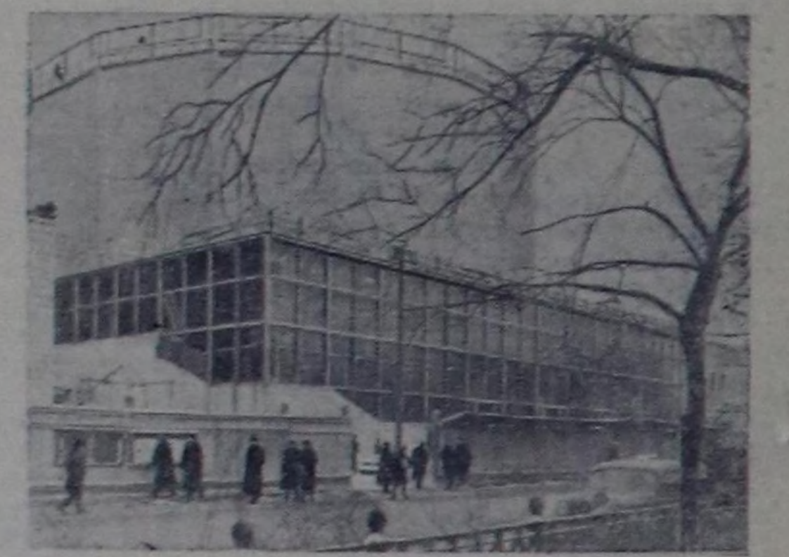
Москваың Цветной бульварында «Тайбы» деп панорамалыг кинотеатрын тудушкуну дооступ турар. Оон көрүкчүлөр залыга 1360 кижи көрөр болгаш кино көргүзөр экранынын узуну 30 метр, бедни 12 метр. Ол экран ыйлыгы эпиток. Чурукта: «Тайбы» деп панорамалыг кинотеатрын бажынынын ниити хевир.

Эрткен чылын элзэн каш чаа дөди өөрчөлдө черлери—Башкар, Кабардин-Валгар, Дагестан болгаш Морда автономнуг республикалары университеттер ажыттынган. Кино улам ылай хөгжөөн.