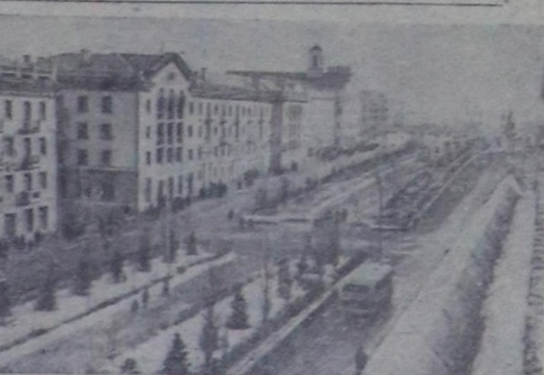
Черингов область Десне хоорай чыл бүрүде чаагайжып турар. Ында уллетпурин, албан черлерини бажынарнын тудушкуну аңгыда хөй квартиралыг чуртталга бажынары туттунган. Чурукта: Хоорайнын төп кудумчузуна чаа чуртталга бажынары.

Чогадыкчылар болгаш рационализаторжулар ийн миллион ажыг саналдарын кириген. Бүдүн чартык миллион чыгымы чогадылгалар, техниктиг сайзырангайжыдылгалар болгаш рационализасчы саналдар шингээтинип ажыгалтынган. Оон ачмыз-биле хөргөңилер камналгазы эрткен чылын 7 миллиард рубль болган.