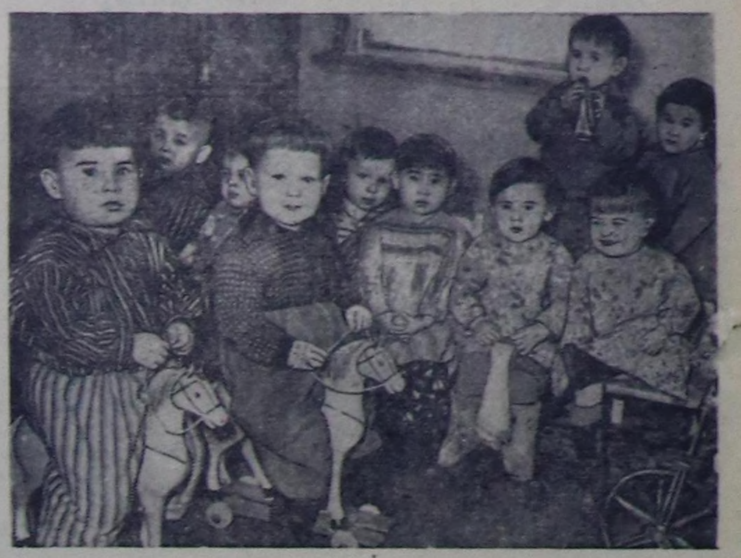
Чурукта: Тес-Хем районун Самгаалай сугра уруглар аселинне.