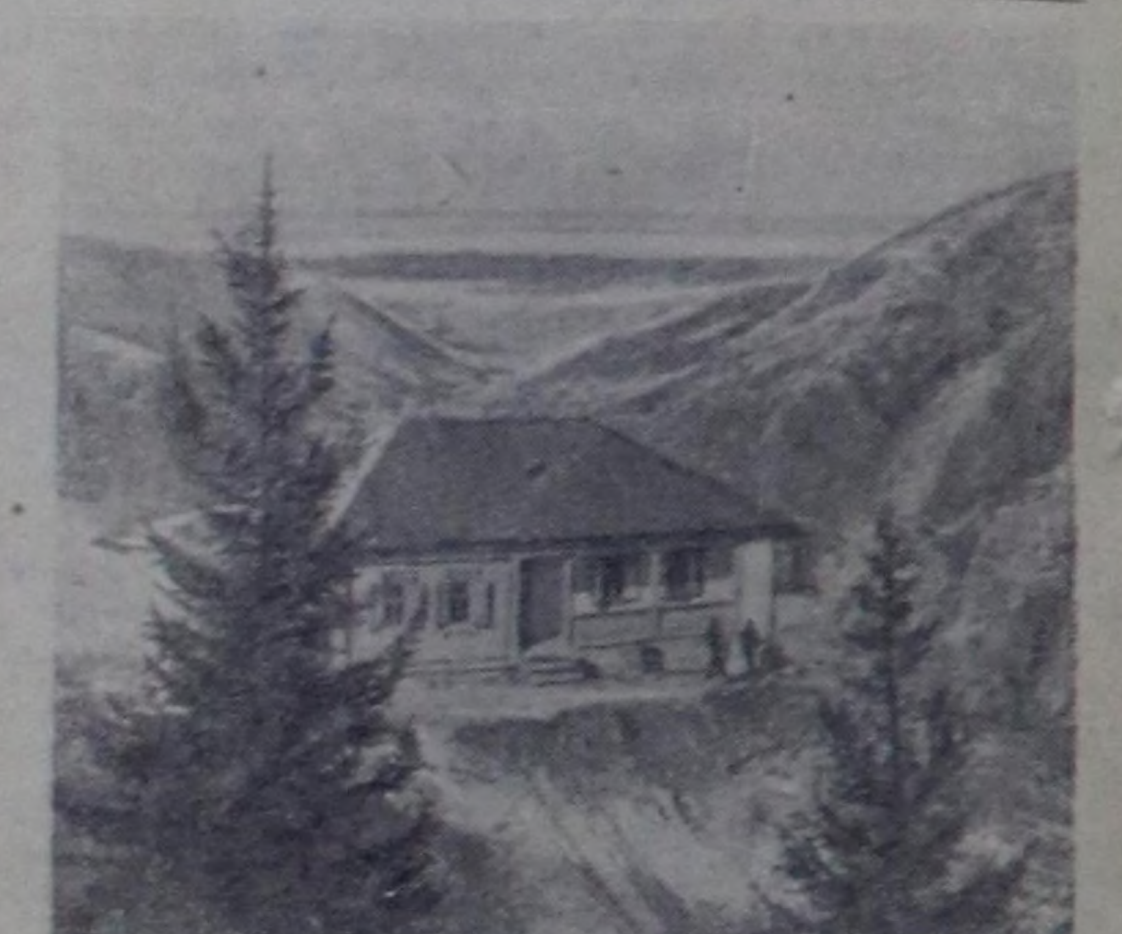
Кыргыз ССР-нің Иссык-Куль облазынын Прижевальский районунуң Сталин аттыг колхозунуң девискээринде Аку хемде инек сүт үнер чер бар. Ам мында колхозчу курорту тургускан. Чурукта: Сталин аттыг колхозтун курортунын бажыны.

Улетпурде болгаш тудушкунда күш-ажылдын бүдүрүкчүлүгү бедидеринин планы 1957 чылда ажыр күүсеттинген. Ажилчынарын күш-ажылынын бүдүрүкчүлүгү уллетпурде 6,5 хуу болгаш тудушкунда 10 хуу өскөн.