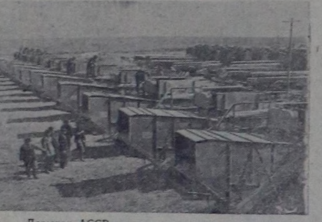
Дагестан АССР-нің машина-трактор станциялары илдээ ажил-агыйның техниканы үзүктөп чок ап турар. Манас МТС-тин механозаторлары эрткен чылын 60 чаа комбайнары, 30 селжаларын болгаш өске-даа хөй-хөй машиналарын алган. Чурукта: Манас МТС-тин девискээринде чаа комбайнар.

Эрткен чылын сүт, эт, дүк, карагул болгаш өске-даа продуктулар белеткелеринин болгаш салып алырынын күрүне планы хуусаа бетинде улуу-биле ажыр күүсеттинген.