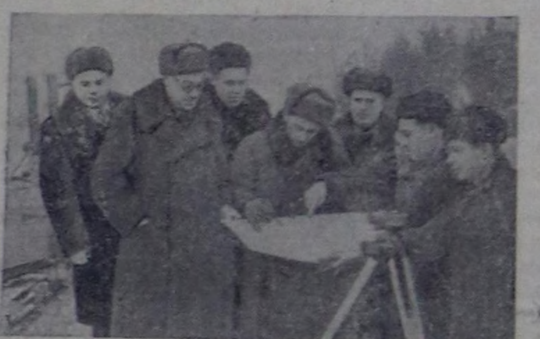
ССРЭ-нің Эртемнер академиязының Сибирь салбыры тургустунган. Оон составында Эртемнер академиязының Барыш-Сибирь, Чөөн-Сибирь, Якут, Ыраккы Чөөн чүк филиалдарын, Сахалиннин комплексинин эртем-шинчиле институтун болгаш Красноярскнин физика институтун кириген. Сибирь салбырынга Новосибирск хоорайнын чыныга эртем хоорайын туудар. Академия хоорайнын тудушкуну эгелзэи.

Иччала-даа кара металлургия, хөмүр даш уллетпур, тууду материалдарын уллетпур болгаш чыгар уллетпур продукциянын бот-үнезин чингидиринин талазы-биле даалгаларын күүсеттинген. Чүвени урей кызырында болгаш бүдүргөччү эвес чарыкталардан когаралдар уллетпурде аждаа улуг бооп арттышкан.