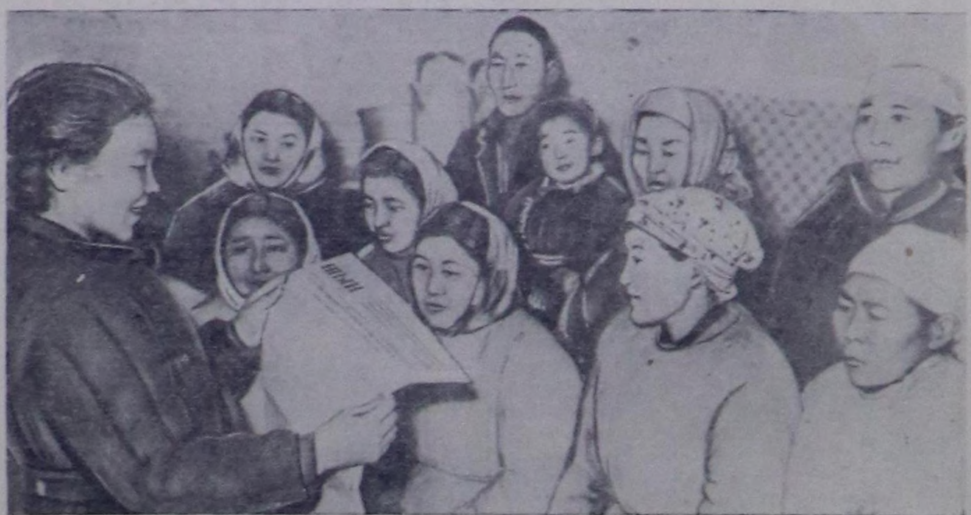
ССРЭ-ниң улус ажыл-агыйын беш чыл планын дусайында эш Н. С. Хрущевтуң СЭКП-ниң XXI съездинге илеткелиниң тезистерин Тес-Хем районда калбаа-биле өөренип турар.

(СЭКП-ниң XXI съездинге Н. С. Хрущевтуң илеткелиниң тезистеринден).