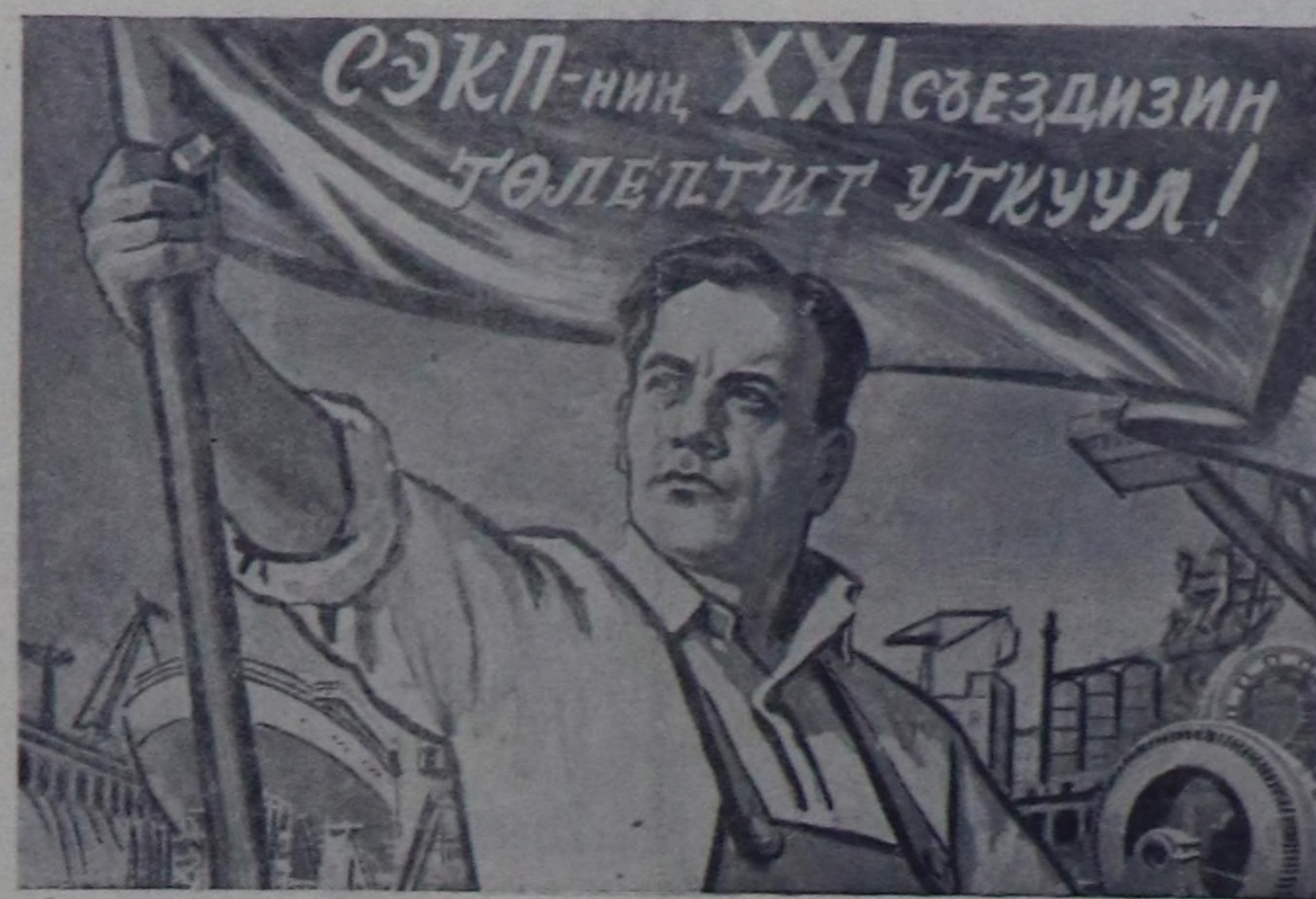
Чурукчу С. Бондарың чурван чурму