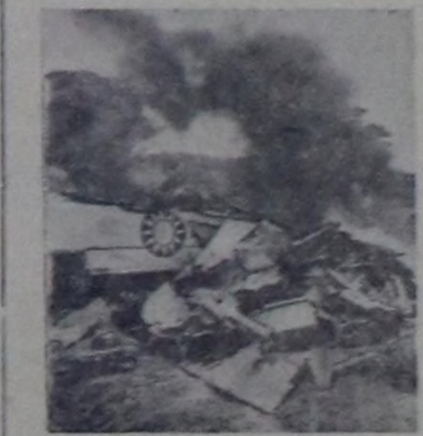
Кыдат Улус Республикасы. Фузянь фронт. Чоокта чаа Улустун-хосталаг армиянын ужудукчулары КУР-нун Фузиянь провинциясынын кырынга ийги улаа агар дөлгөмөрийн үрөш аткан. Парашот-биле октаттырган бир ужудукчу тудун алган.

ССРЭ-нин Министрлер Чөвүлөлдө-лүг даргазы Н. С. Хрущевтуң Кремльге болган парлагга конфе-ренциянын дугайында озун-вар дындалган.