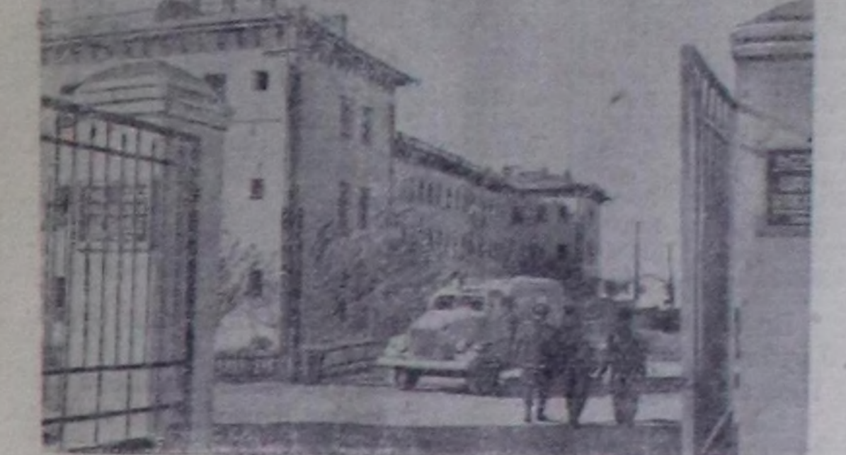
Узбек ССР. Агренте шахтерларын чаа өмнөткөн. СЭТА-ның фотохроникасы.