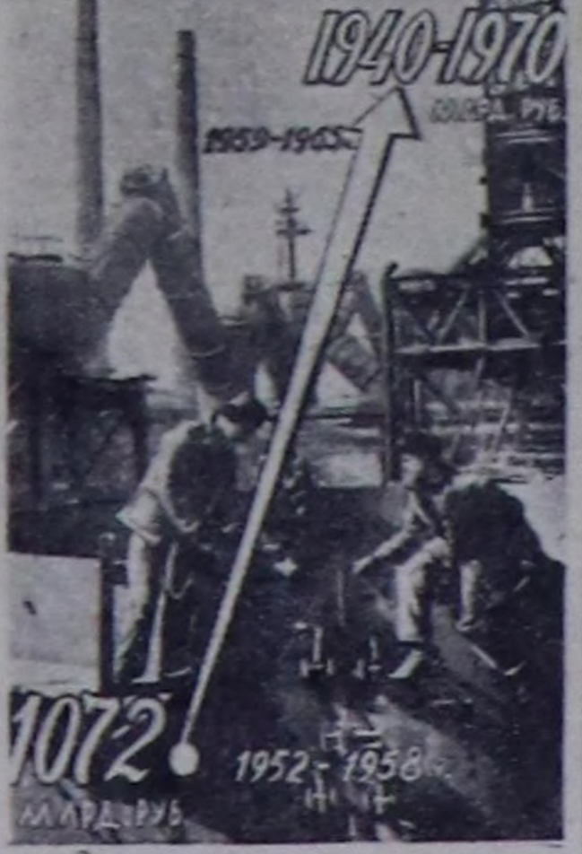
Улус ажыл-агыйның капитал салымшыкыны.

биле чугула хөгжөлгө чеди чылдар дүргүзүндө чөрүттүрүр. Ажыл төлөвүнүн турмулуг таарымштырар, өзөш болгаш ортумак шактыг ажылчынарынын, албан-халкычынарынын ажыл төлөвүнүн бедир талазы-биле улуг хөгжөлгөн боттандырар. Эвөөн шактыг ажылчынарының болгаш албан-халкычынарының айда ажыл төлөвүнүн чеди чылдар дүргүзүндө 270—350 рубльден 500—600 рубль чедир бедир. Уруглар яслилерин, салтарын, шкөөл-интернаттарын калбартырына, а ол ышкаш кырганнар ба-