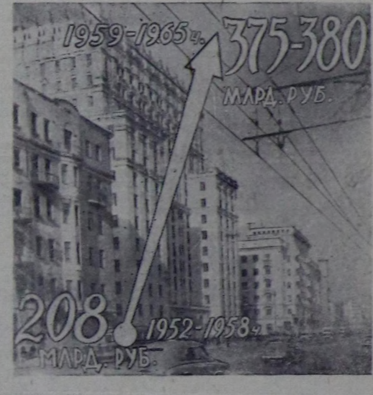
Чурттага болгаш коммунал туудунга капитал салымшыкыны.

Капитал тудугуна хемчээлинин өзүп турары-биле калбартыр материалдарын, хөргөнгилерин камгалалыг чарыкдары улуг ужуру-дузалыг болуп турарын чеди чыл планында чүгүлөтүп айтып турар. Тудугуна амгы үедеги хемчээлине тудуг-монтаж ажылдарының смет өртөөн бир хуу куудалдырга бир миллиард ажыг рубль камгалалы бөр. Ычанган чеди чылдарын дүргүзүндө тудуг-монтаж ажылдарынын үнесин 6 хуудан өзөш өзөс куудалган турар ужурут. Чурттага байжынарынын туудунга көрбөлчүн метр чурттага шөгүнүн үнесин 14 хуудан өзөш өзөс чигидери контроль чуратайларда көрдүгүп турар. 1959—1965 чылдарда тудугта күш-ажылдың бүдүрүлгөсүнүн 60—65 хуу бедирин көрдүгөн. Ол чорук айттыгына планын дүргөн болгаш чеди чылдың күрөсүн арганы бөр.