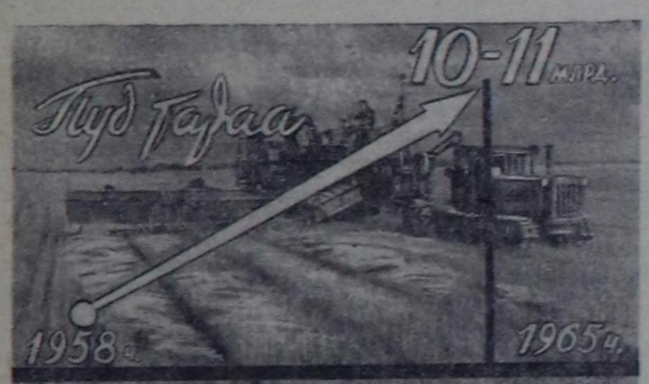
Чеди чылдың төнчүзүндө бир чылда тараа бүдүрүлгөсү.