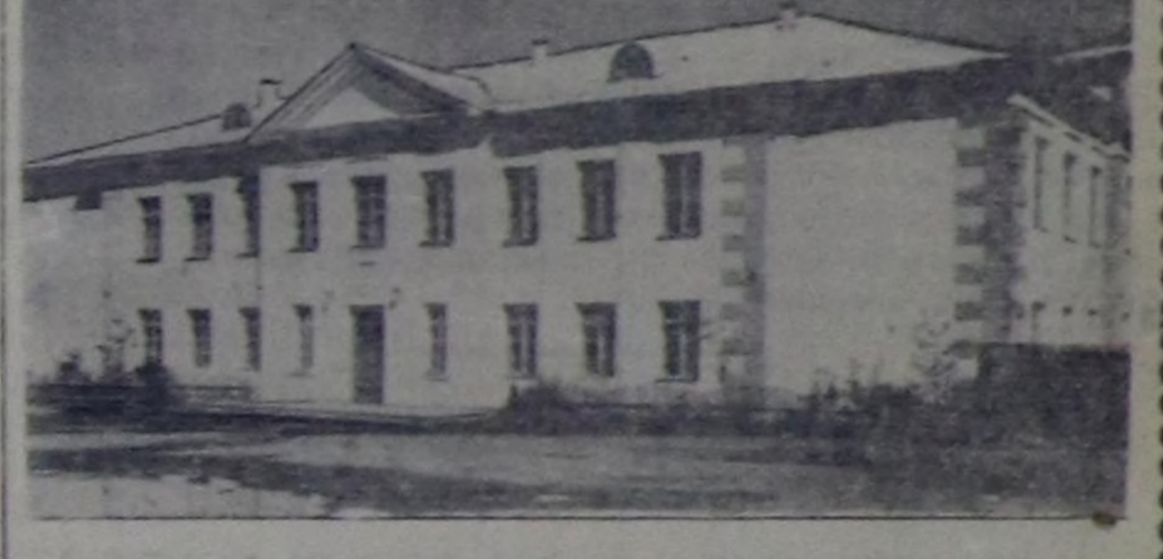
Чурукта: № 10 школаның бажымы.