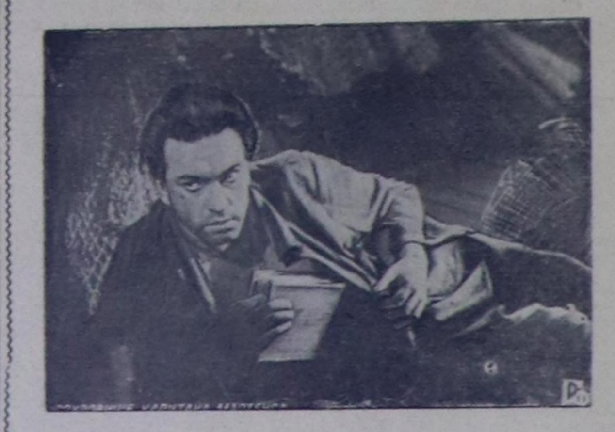
«КАПИТАН МАРТЕНСЫҢ ШЫҖАВЫҖЫ» деп кинону көрүңер.

1958 чылдың III кварталыңга төлөө хуусалыг элчөлөгил гөпсө: ледин банкынын нөсөдөсүңга БО ЧЫЛДЫҢ СЕНТЯБРЬНЫҢ 15-КЕ ЧЕДИР ТӨЛЕП ИИРИГЕН ТУРАҖЫН