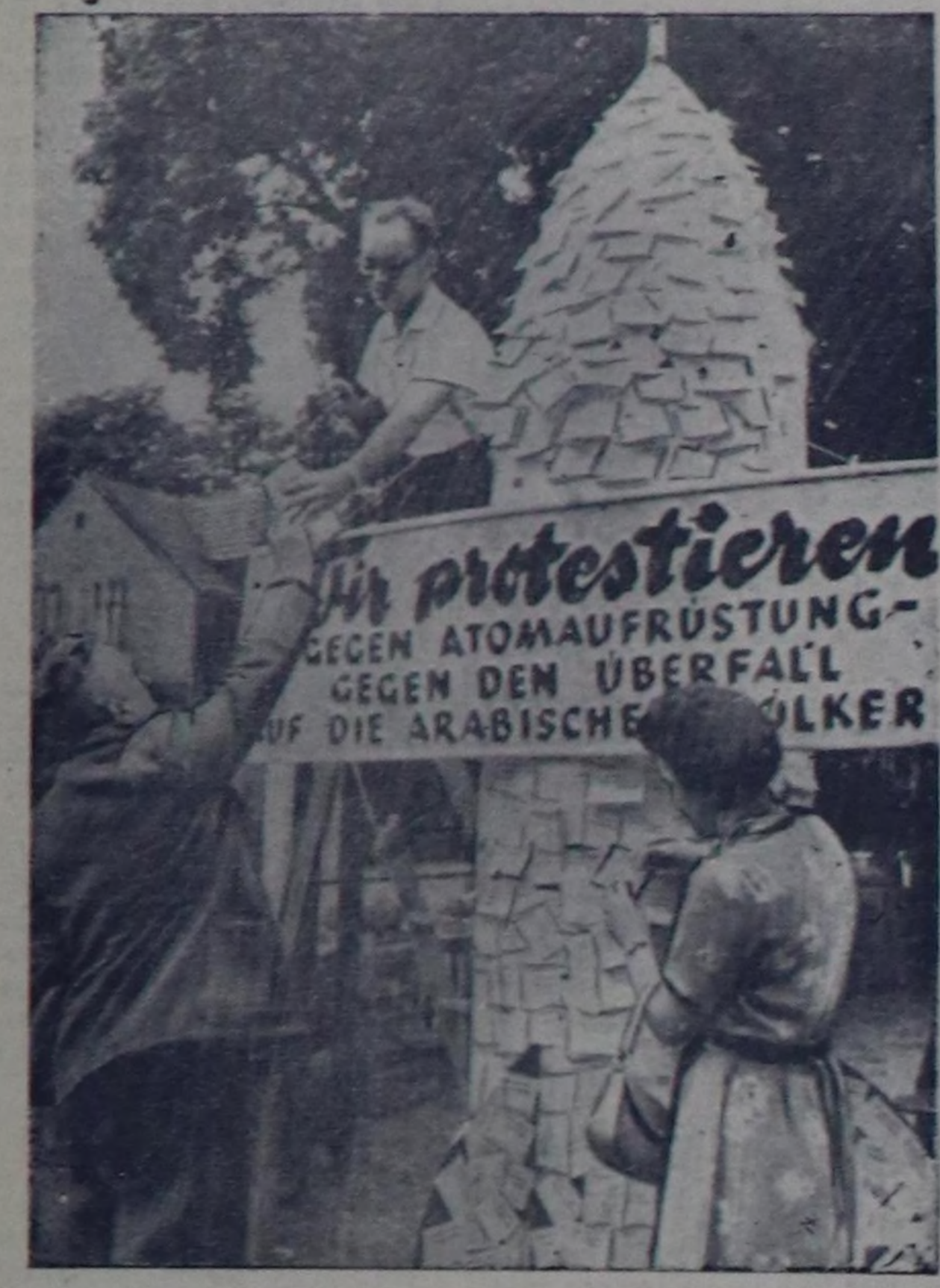
Барын термин шериги атомнуг чөпсөк-биле чөпсөкдөргө Герман Демократтыг Республикасында ажылчы чоннары шийтерилг удураанын турар.

Чурукта: Демократтыг Германияны Национал фронтунун тус чер комитетинин эгелээшкннн буугаар Раисорфта ат салышышканын чымып турары. Бүдүрүскениң билдөөшкннн хоорайын чурттакчылары атомнуг бомбаны улуг хевир кыдыр каттыштыр чымыргарш культура бажынын баарың дургууң турары.