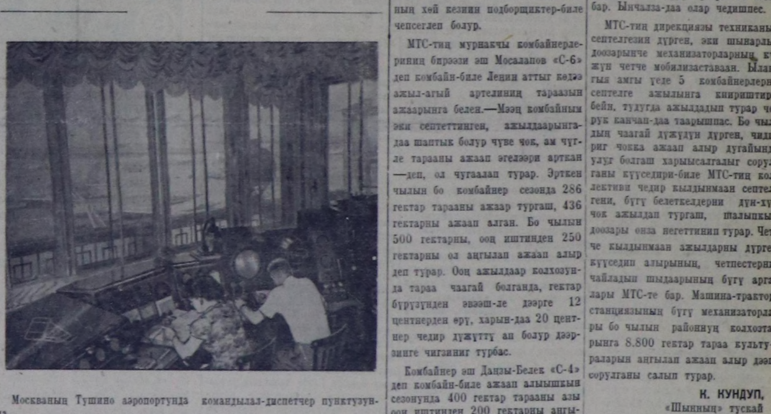
Москваның Тушино аэропортунда командирлар-диспетчер пунктүзүндө.

МТС-тин мурнакчы комбайнерлеринин бирөөн эш Мосаалов «С-6» деп комбайн-биле Ленин аттыг кедө амык-агы артезиин тараанын ажаарынга белең.—Мээң комбайнын эки септеттенин, амыкчыларын-даа шаныгы болуп чүсө чөк, ам чүгө тарааны ажаап өгөдөрү арткаан—деп, ол чугулаап туура. Эрткен чымын бо комбайнер сезонда 286 гектар тарааны ажаар турган, 436 гектарын ажаап алган. Бо чымын 500 гектарын, оон иштинден 250 гектарын ол анылаар ажаап алыр деп туура. Оон амыклар колхозунда тараа чагай болганда, гектар бүрүзүндө эвөш-ле дөргө 12 центнерден өрү, харын-даа 20 центнер чедир дүжүттү ап болур дөргөнчө чиганын турбас.