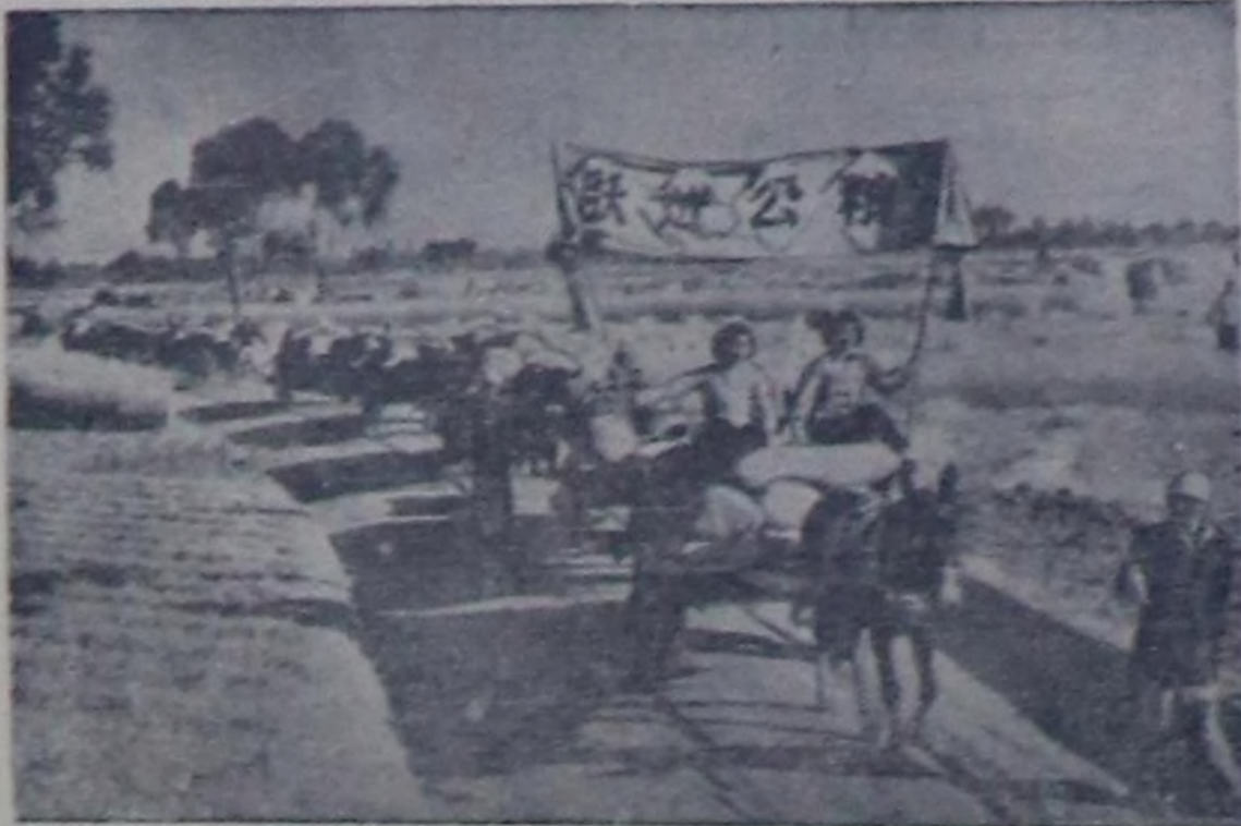
Кыдат Улус Республика. Көдө ажы-агымынч бөдүктөге кооперативтери анык-аңы чөкөлдө түргөңө тарга дүжүргөдө кирешкен. Чурунга: Анго уездинч Фейно суурга (Хабей провинция) көдө ажы-агы кооперациямынч кижигүнеринч күргөңө та-рамынч садыр-биле сөөртүп бар чорутуу.