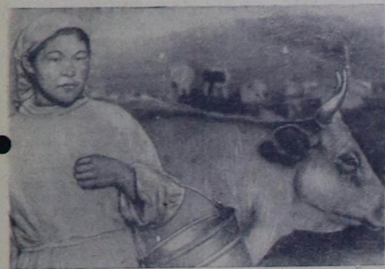
Чурукта: Барлык-Хемчик районда «Барлык» совхозтун түп сүт-баран фермасынын салымы Күжүктөгү Чыскар. Чыл дургуунда өскөн бүрүздүн 1800 кг сүт саап алып деп ол хулаага алган, ам бир инектен-не 1020 кг сүттү саап алган