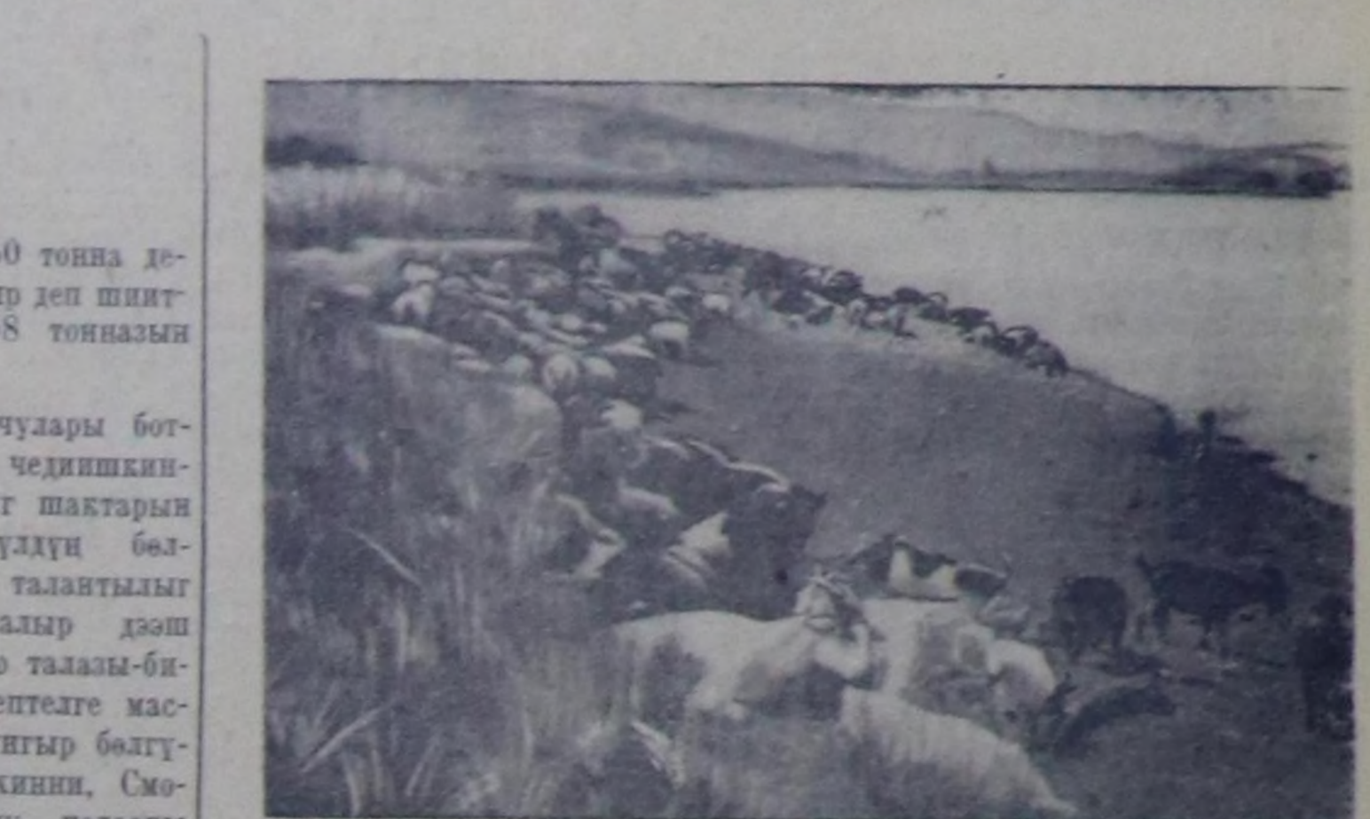
Чурукта: Бин-Хем районун «Совет Тыва» колхозунуң сурап-хөйкүзү эш Мижит-бодуң хөйлары Улуг-Хеминиң кидиниңа дүштөш дьштанылында демдеп турары.

Иракта национал революциянын тилгелери бүгү Ортааки Чөөн чүкте империализмниң контролун эңне күштүгү баксыратышын барып шыдаас. Ортааки Чөөн чүк империалистиң араатанарга кезаде тываажан ораны болуп, ыччала-даа ол районун ээлеген—араб улустарга тамы болуп келген. Америк болгаш англи империализм Ортааки Чөөн чүктү чурттарынын нефтинден эгертүүн хей ажал-кочаны соруп ал келген. Империалистерин болгаш оларның агентилерин мөлчүктүшүңүң болгаш кадыг-дошкун чагарышкынының үрүшү-биле араб улустарын калбак массалары дендин түрегелде чурттап турар. Хамаарышас чорукту