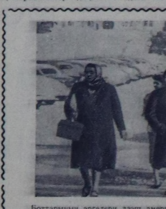
Боттарынын өргөлери дээш америк иерлерини демисели АКШ-та эки не ыяш-бүрү хейирлерин болуп турар. Чурукта: Монтомери хоорайнын (Алабама штатта) кудумчулары-биле иер керээженерин ажилче чадар бар чорукчу. «Өгүр кештиргез» озагай олуттарын хоорай автобстарына тускаал турарына удуралашкан, иер чон инитинин транспортун ажилдакчылар чоруктан шиттирлин-биле отталат турар. АКШ-та иер чонун илгай, доромчлап көөр чорук улам-на күштелип турар болгаш иер чон илдеп чорукка удур боттарынын демиселин бичи-даа кошкатпайн турар.

Венгр күрүненин удуртукчулары болгаш совет аалчылары байырлыг хуралдын киржикчилери диниттиг адыш чакашкыны-биле утказыпканар.