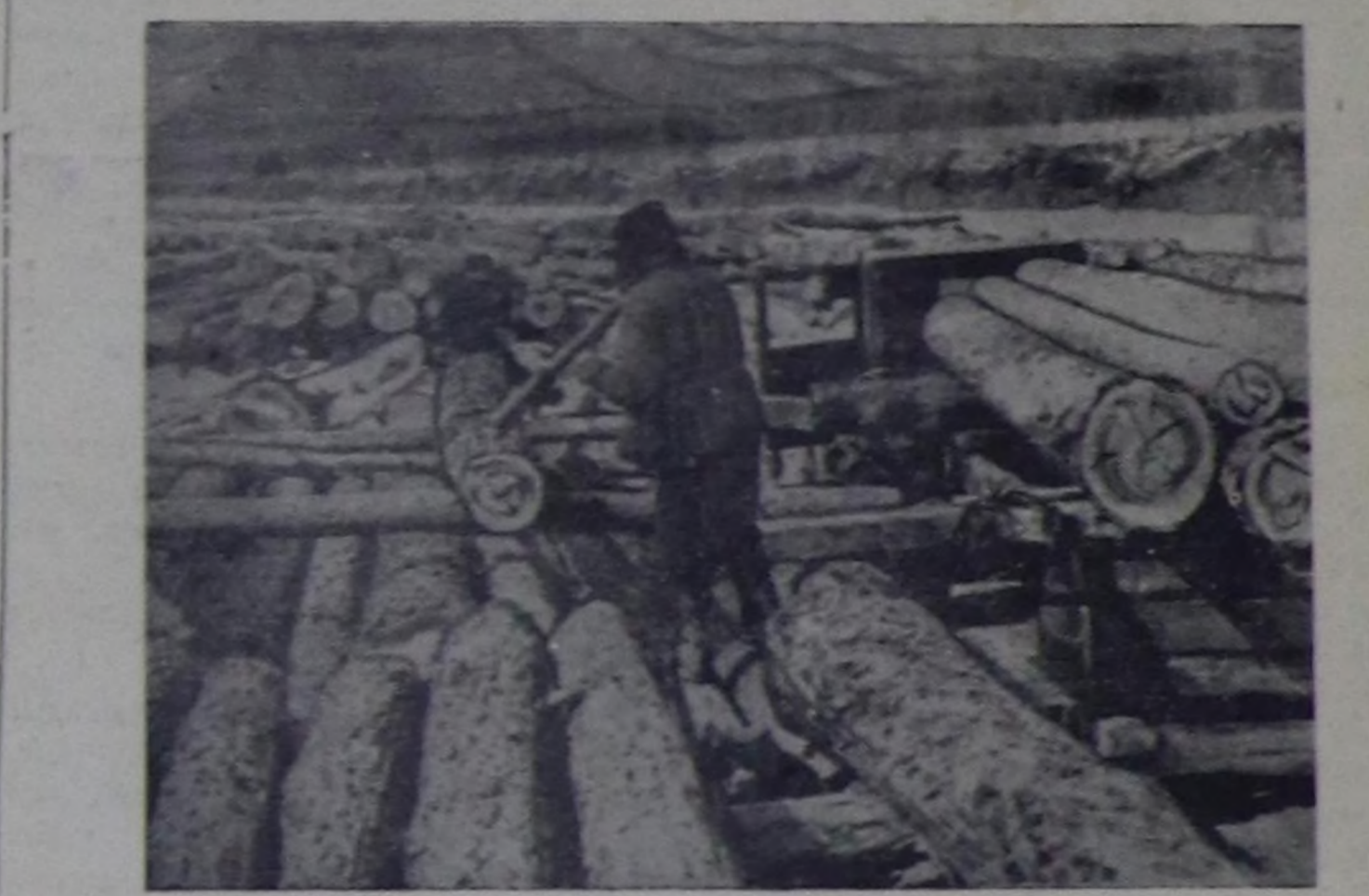
Чурукта: дүжүрүчүлөринч бригадаларынч тудуг мыжын хем унунда дүжүрүп турары.

Ажыг шагы доозулганда ыяш белеткелчилеринч чурттаарынч таарыштырынч тургускан ийи эвөно, 10 ажыг орунарлыг баракта ажылчыларынч чамынынч чепменген, өскелери өрткөн хүнүнч ажылынч дугайын чугаалашкан турган. Чолаачылар ыяш сөөрттүгөйинч дүрөдөйгү дугайын чугаалажып, хүндүс орук чоруттумас апарга, дүне сөөрттүр деп дугурушкан турганар. Ол аразында бригадир ийрин келгеш, ханада азын каан көргүтүп самбырамынч дүгүнү көргүтүлгөйинч бадан, бөдүн кижин бедүрүшүнч кылган ийинч түнелдерин билип өгөлдү. Норма күсүсүткөн кижин барык-ла чөк. А чолаачы С. Килининч алдынынч дүжүндү—