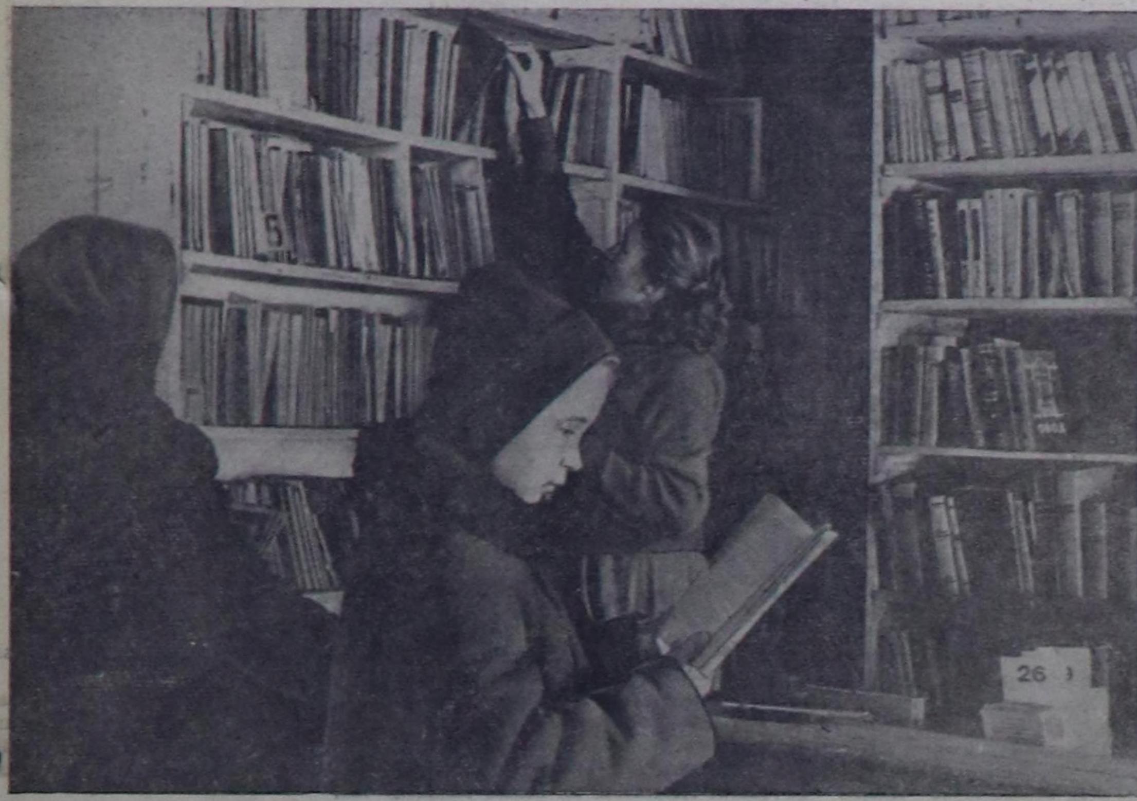
Талы районун төвү Бай-Хаак суур чыл санында-ла чараштыр туттунуп, хей-хей чаа бажындар нөмөжип турар. Оң-биле кады культура амдыралың туугулары база кевүдөн. Чокта чаа анаа уругларның библиотеказы амыттырган. Ол библиотека чүгө бир ай ичинде ачылды болган бичиш көчүрүчүлүнүн саны 183 кижил четкен.