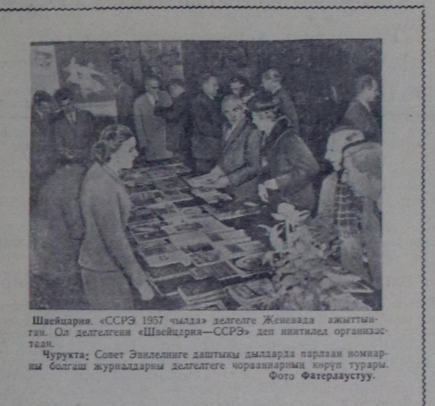
Швейцария. «СССР 1957 чылда» делгелге Женевда ажыттыган. Ол делгелге «Швейцария—СССР» деп ийитиле организа-таан.

Француз солуннарнын паралаан испан команияларынч динатканын бугаар алдыга Эль-Айин районуна тулчуушкун-га марокконнар 241 кижизин аурткан; испаннар 51 кижизин аурткен болгаш бажызатканар.