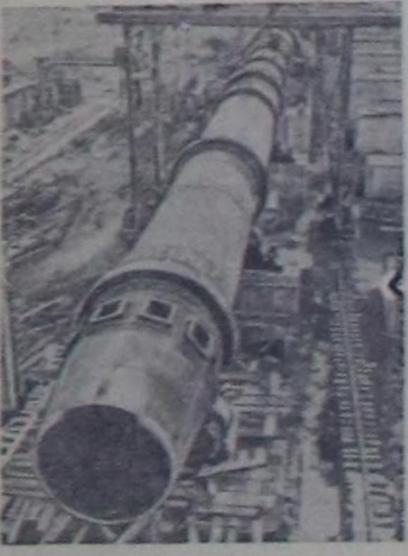
Чехословак Республика. Словакияда Банск-Бистрицаның чымыда республикада улут цемент заводун кылып турар. Ону совет инженерлеринин төлөвилелин өзүгаар кылып турар.