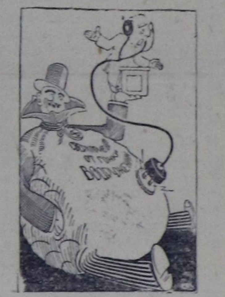
Америк чажыркыч бодуктерин төлөөлөкчиси чепсектегишкениниң дүжүрүниң дугайын аскы чарыкыме алжырып турарок, АКШ-та дайын чепсектерин овалаландыр эидере бодуруп турары чачым болган.

Француз аждарың илчестеп-сүрүп турарының дугайын солуннар база дыңнаткан. Мракта-ла долу аяк меделээр өзүгаар алмыра, 1957 чылдың дүргүзүндө полицейга үлөлдөргө түңгөнүң да чүгө Метрополига бейи 4819 солгү-африкаларын туруп хоругдаан, оларның дык хейиу сөөлдөк барып Франциядан үндүр шөлүшкөн.