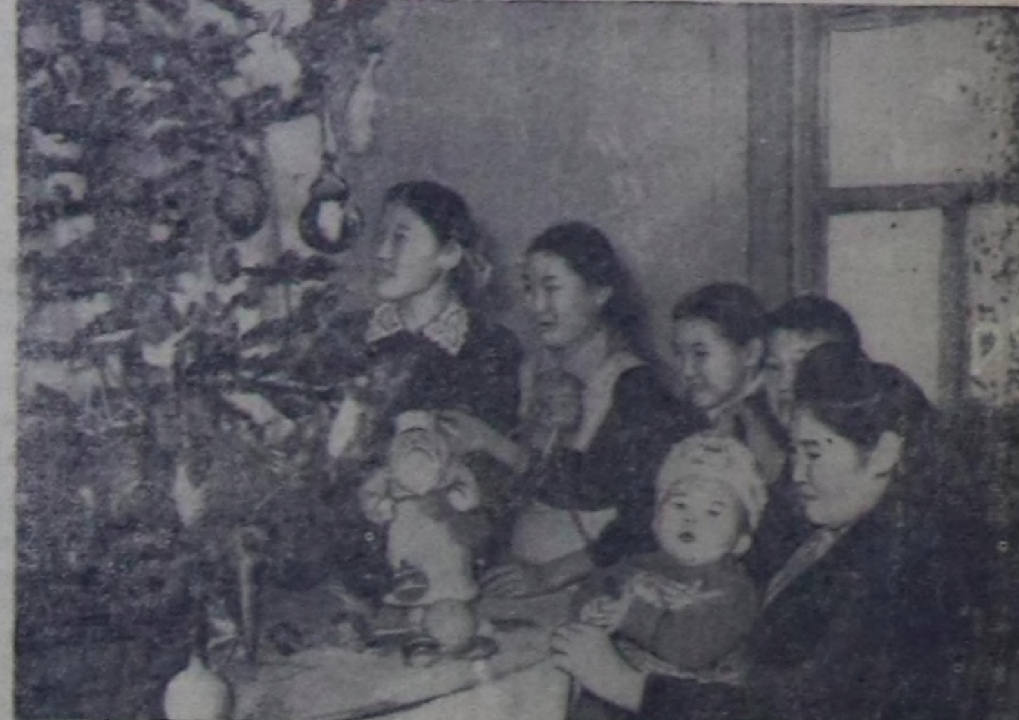
Елкань эң сөөлүгү каасташкынында.

Бүдүрүлгенин кызырылгалыг ажылчына-рын ажылда массалымы-биле үндүрөр чорук-ту болурун турар. Албан дугаар мез-дээрин барымдалааш алдыр, 1957 чылдын ортаа үезинде чуртка долузу-биле ажыл чөк 3,2 миллион ажылчынар санатылган турган. Сөөлүгү ийи-үш айларын дүргү-зүлде ол сан улугу-биле өскөн. «Юнайт-стейтс Нью энд Уорлд рипорт» деп сет-күүдүн дыналынын дугаар алдыр, амгы үеде чуртта 3,7 миллион ажыл чоктар бар болуп турар. Долузу-биле ажыл чоктар-нын саны 1958 чылдын февралда 4,5 миллион кижиге ажа бээр деп «Ньюс и-нформейшн» баш бурунгар соглеп турар, а ийинге чөдир ол сан 5 миллион ажыг.