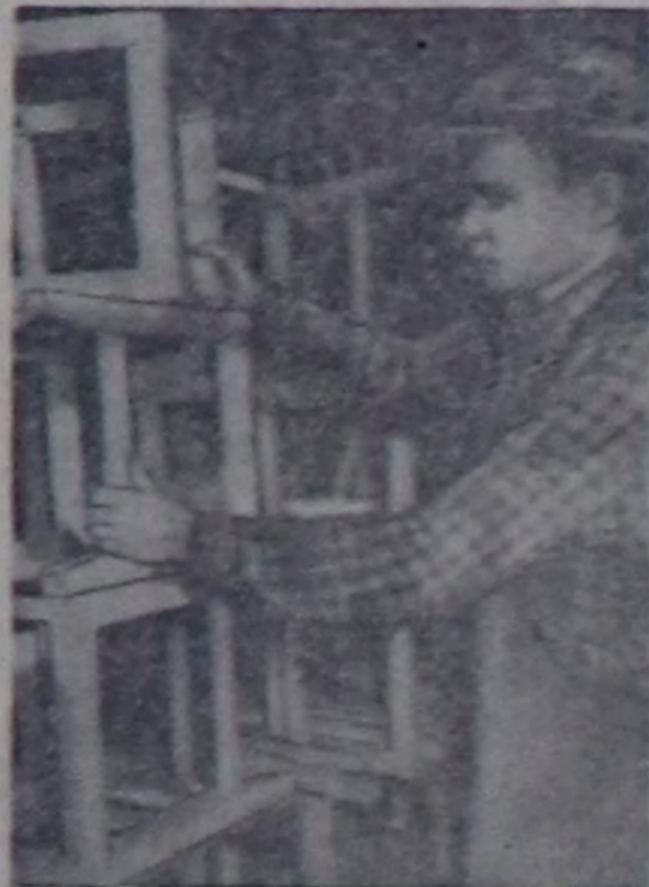
Чурукта: Кызылмай мебель фабрикасынын столлары Н. Боталов.