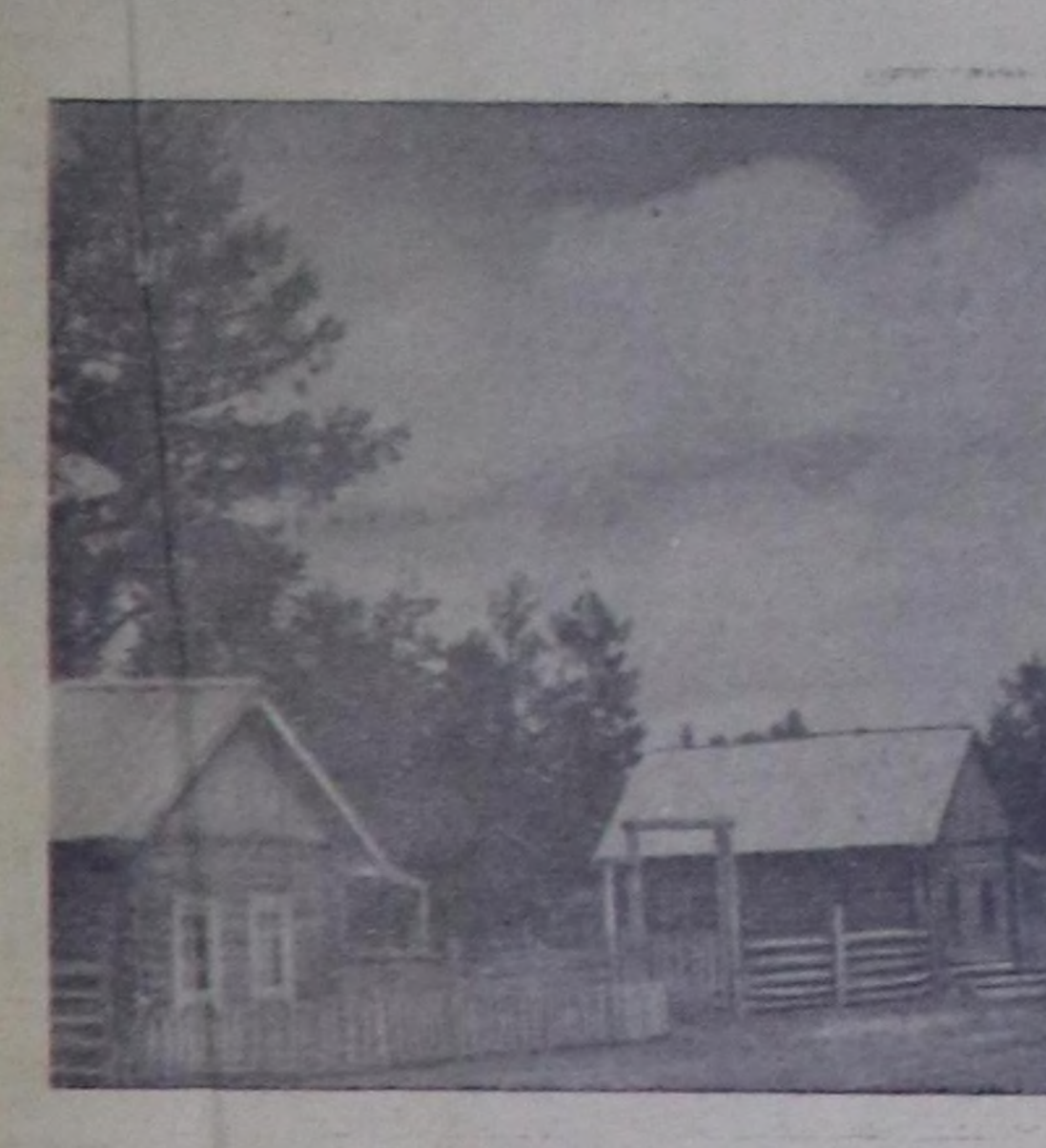
Өвүр райондун «Торгалыг» колхозу чыл бүрдө өзүп сайырап, чурттаган иш, культура-амдыралдын, бүдүрүлгенин болган өскө-даа бажыңнары түүтүн үп турар. Чурумта. «Торгалыг» колхозунуң сууру.