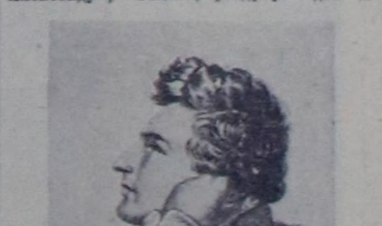
Гейнедин мөчөөнүндөн бээр чыл өртсө-даа оң кичи төрөлгөнү артырып каан үнөдү артынан амгы үеде реакциянын күжүгө улур делегейни мурнакчы кижилеринин демиселинге улур укур-дузалык болуп турар.