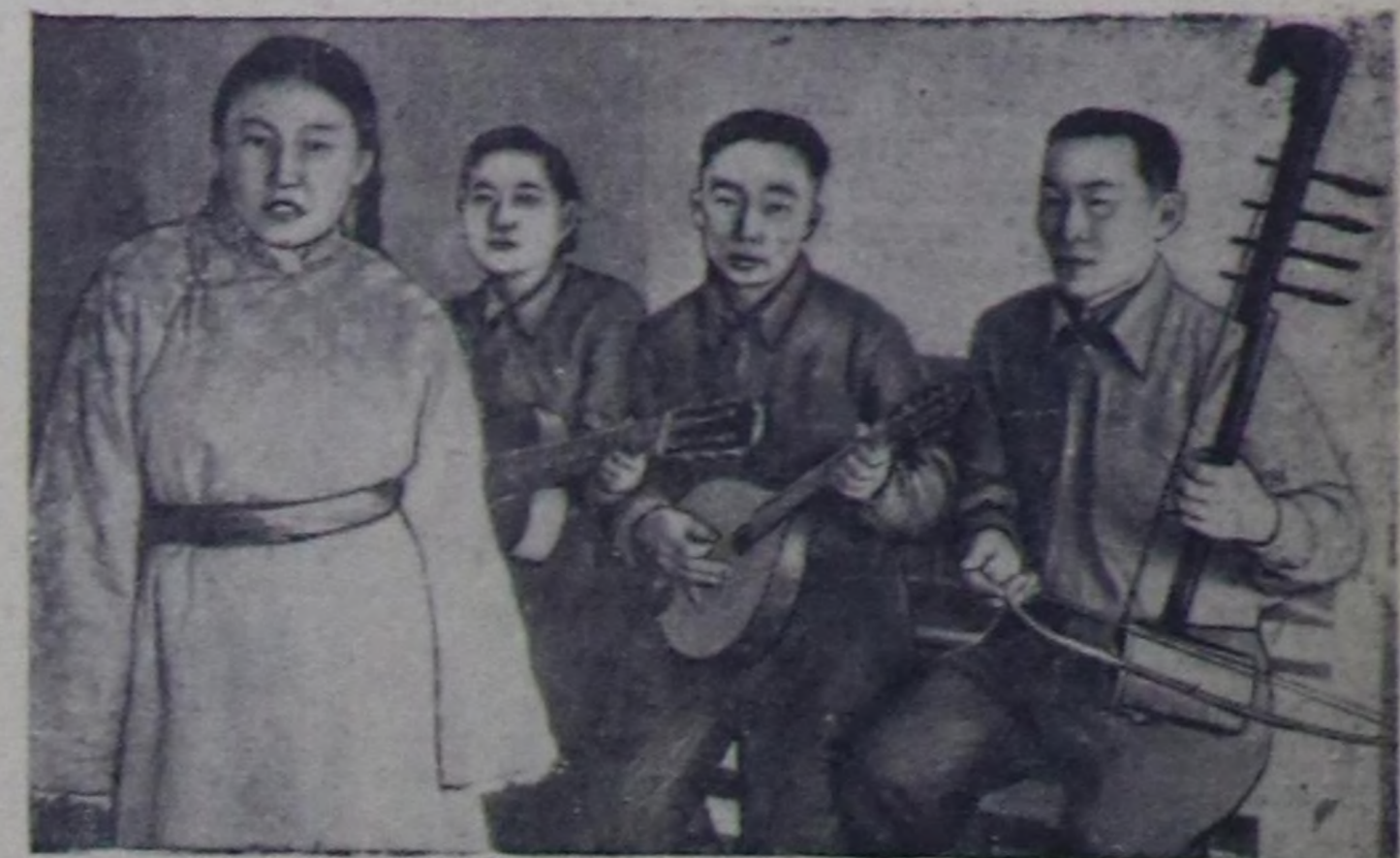
Чадаана көдээ Советтин клубуна уран-чүүл бөлгүмү доктаамал ажылдап, колхоз төвүнде, фермаларда болгаш бригадаларда колхозчуларга чаз-чаз концерттерни көргүзүп чоруп турар. Чурукта: уран-чүүл бөлгүмүнүн киржичилериниң дараазында концертке белеткенип турары.

Чадаана көдээ Советтинг ажылынга хамаарышкан материалдарны моон адаанда парладывыс.