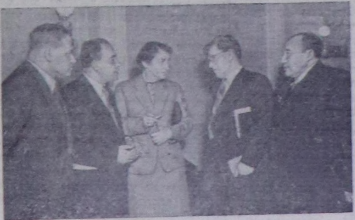
Чурунта: Совет чогаалчыларың ийиң Бүгү-өңгөл съез- диниң төлөөлөрү. Солгай талазыңдан ол талазыңдан — В. Ладее (Латвия ССР), А. Корнейчук (Украина ССР), В. Ва- силевская (Латвия ССР), А. Сурков (Москва) болгаш М. Ау- зов (Базах ССР).

РСФСР-ның Дээди Советинге болгаш чөчөр Советтеринге соңгулдалар хүнүң- ге уткуштур колхозчу тараачылар часкы хөвү ажылында белеткениң доозарын хү- дөөгөң. Одобрене чымыдыр, ону та- рылга участкаларыңче сөөртүп кижилер- ни тускайлаан, олар кызымы ажитанды турар. Чөдөр-хөдөөк, дөшкөр четчел- лен септөр ажитанды база организаци- зыңа.