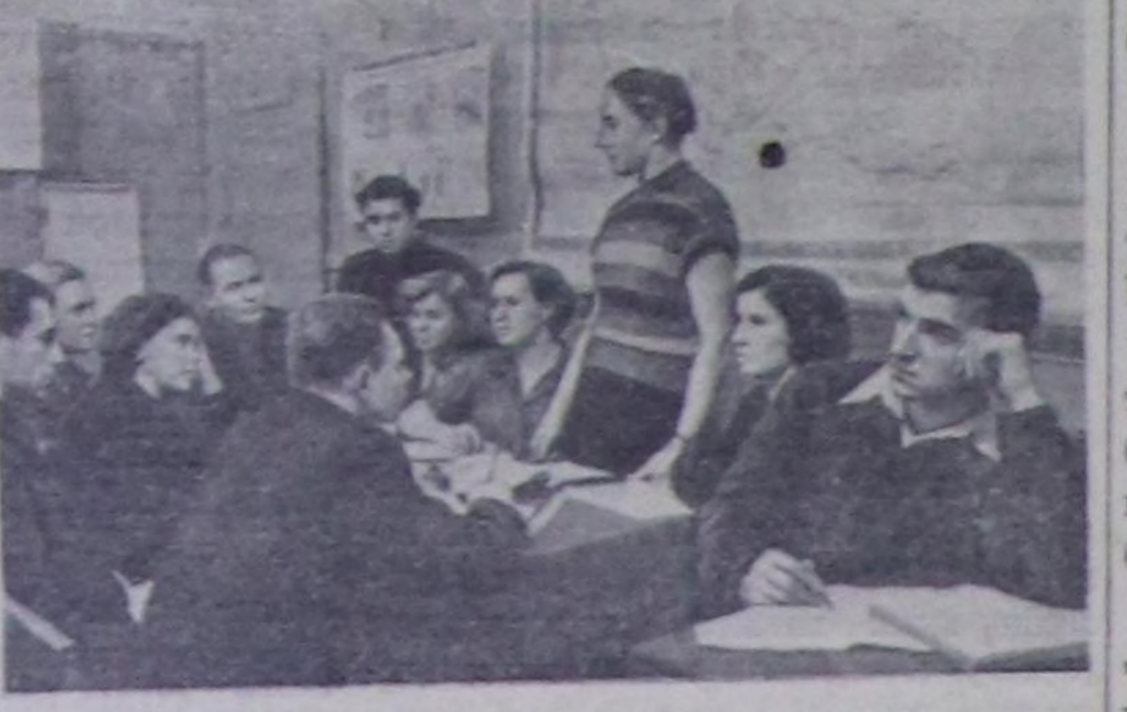
Москва. Сталин аттыг автозаводтун дык хөй аныяк ажылчылары болгаш албан-таарычылар партия чыры- дышыкының четкининиң бөжүмнеринде улуг соңуургал- ды өренип турарлар. Чурунта: СЭП төөгүтүңүң дөшчү күрүң өөренирниниң талазы-биле комсомол бөжүмүңдө өөредилге.