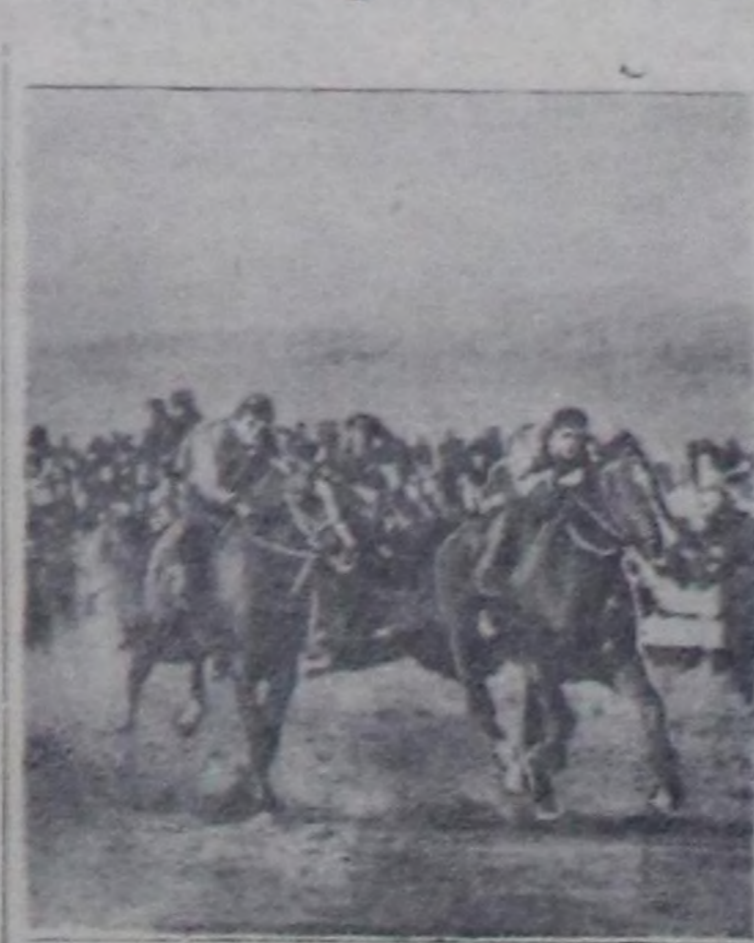
«Искра» колхозунун «Мила ит-ренюха» деп беи оон соон дэрий, ден чыгып келген.

Дон болган бүденновчу уксааларың 4 харыг хайнактарының 4200 метр черге чедир чарыж көрүктүлөрүн ки-чэнгебиң хаара тудуп шылаан. Боларын аразында Чадааның дуржулга станция-