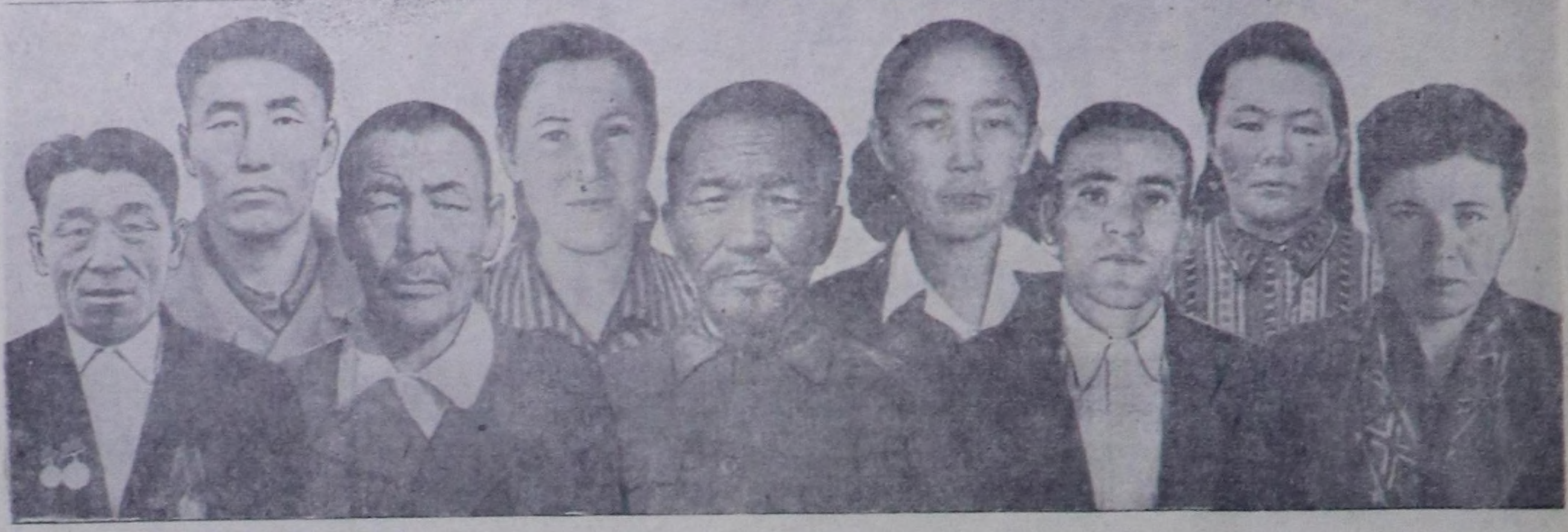
Бистиң областың үстүрүндө, көжө ажыл-агыйында болган культуразында мурнакчы ажылчыларнын болган колхозчуларнын база интеллигентиянын чөдүп улуг көргөдөп турар.

Бо хүнерде экскурсиячылар уда-дарааштыр көп турар.