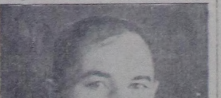
Бистин комбинатынын ажилы сөөгү үлө экижип турар.

Улетпүрү улам ылай көдүрөр, техник-тиг депинде болгаш бугурулгени организа-стастарын экиждер талаан-биле СЭКИ ТБ-ниң иль Пленумунуң төгүзүгү шийти-рлерин Шагаа-Артыгың райлетпүрү комбинатының ажилчылары болгаш ал-бан-хаакчылары бүгү совет улус-биле бир дөмөй улап сорук кырышкы-биле хүлээп алган бис.