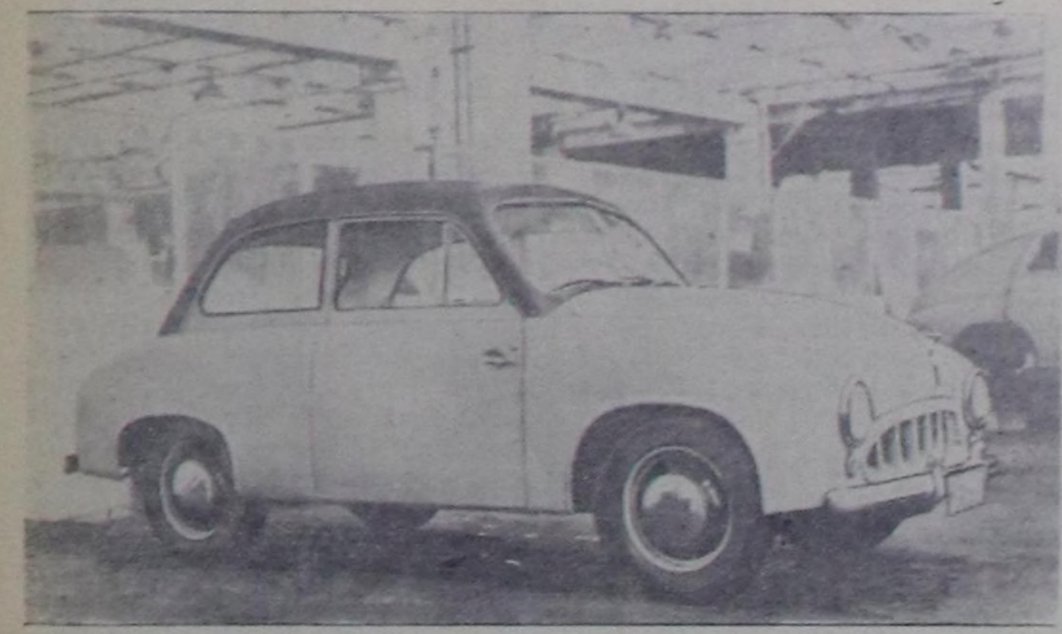
Варшаваның чик автомобильдер заводу «Сирена» деп өзөөш литражыгы автомобилдердин бүдүргөсүн шыгээди алган. Чаа машина 100 километрге 7,5 литр бензинин чарыгдар болгаш шапта 100 километр чедир дүргөн чоруп болур. Чурукта: чаа польша машина.