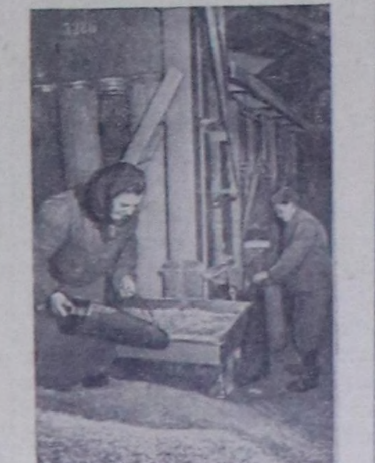
Чурукта: советтун ийги салгырында үрөкчү таранын арылган турары.

Эртен чыдын чазын Саягород чанынга тургузунган «Алтай» советтик чакыч тарылгага эки белеткеннн турар.