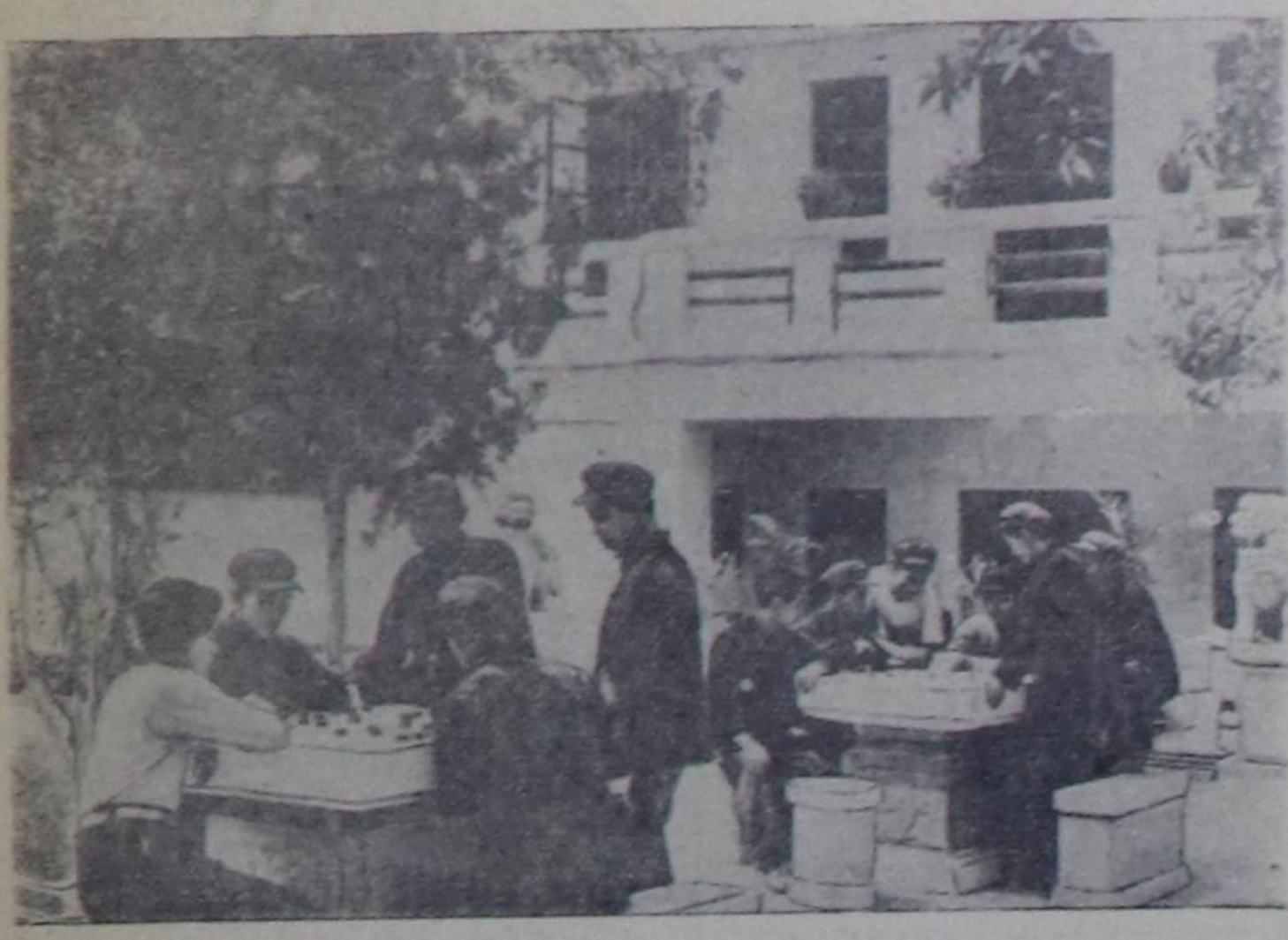
Гуандун жокунун Шанькиде културанын ажылчын ордуу—Кыдат Улус Республикага чоокта чаа туттулган хей-хей култура албан черлеринин бирөөсү болур. Ордуна театр залы, библиотека болгаш номчулга чери, гимнастика кылар зал, дыштанырлык болгаш култура хемчегер чорударынын черлери бар.