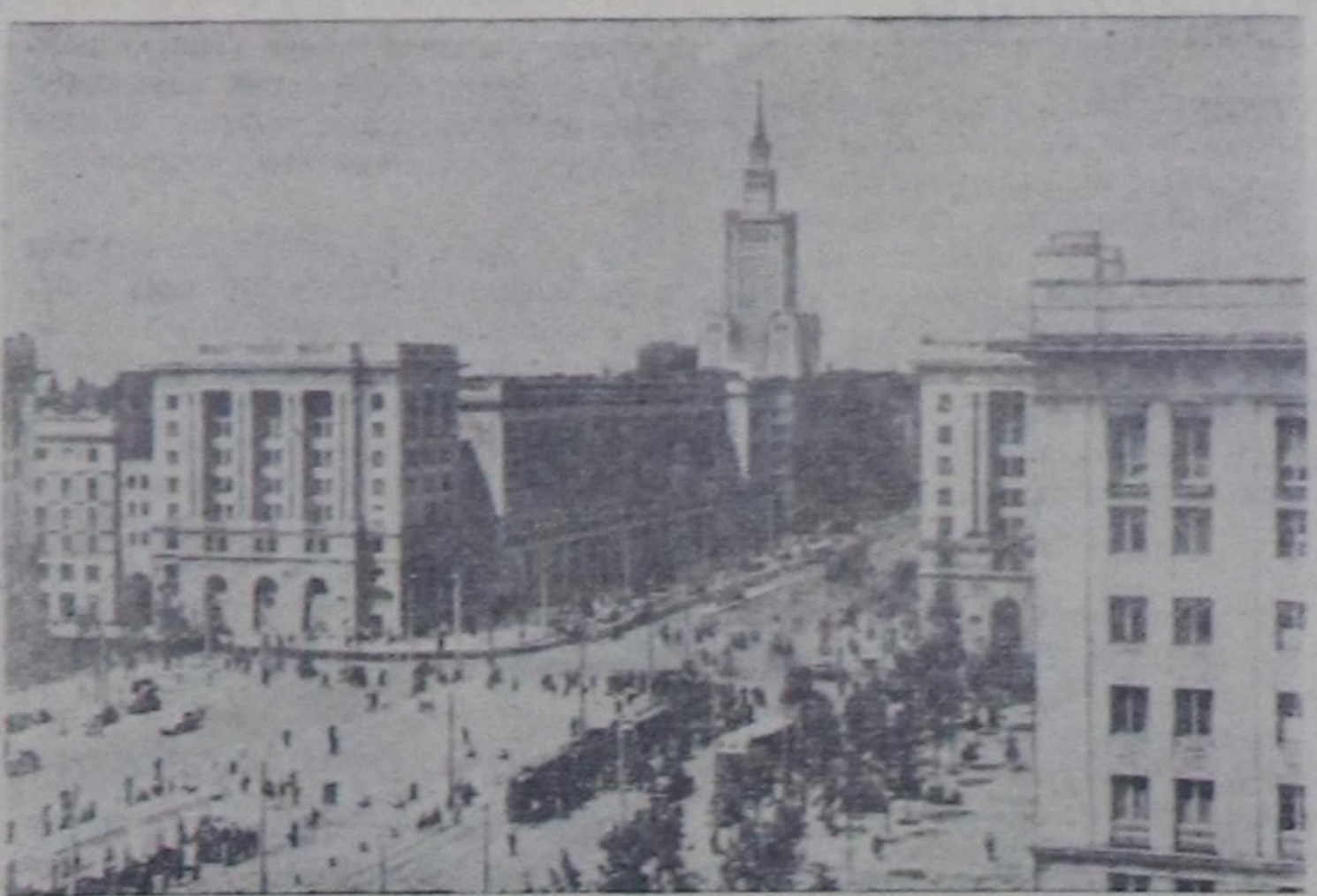
Польша Улус Республикасы. Варшавада Конституция шөвү.

Совет төлөөлөр амгы турун турар таарымчалыг бойдалды эчинеңе чедир ажылдарын боттарынын хүдөзгезин деп санап турар болган дөрт күрүөлөргөн чазактар баштыктарының чөвүлел хуралы бүтү делегейде миллион-миллион кижилернин азап салып турар идегени шынчыктыр тур төлөөлөр, совет төлөөлөр бөгүнүчү талазынан оон хамааржыр бүтү чүгүдери кылдыр.