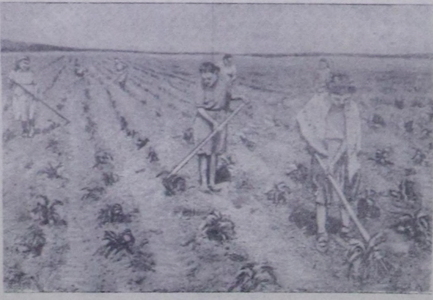
Бо чымлы Таңды районун «Революцияның чалбымы» колхозу 111 гектар кукуруза тараан. Оң үнүгү эки. Кукурузаны ажаары-биле Алдын-оол баштаан аныктарың тускай бригадын тургускаан.

Чурунта: эвенонун тарылганы ажаары турары.