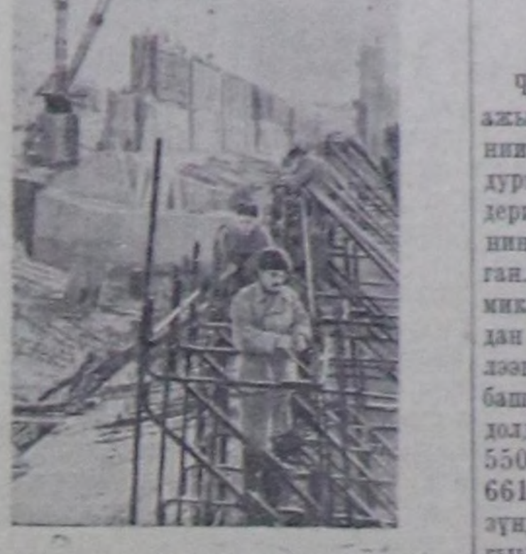
Новосибирск. Новосибирскиниң гидроэлектростанцияның тудушкунунда ажилдар улам дүргөп темпирлерин чоруп турар. Чурукта: судно өртөр шлюзунуң тудушкуну.