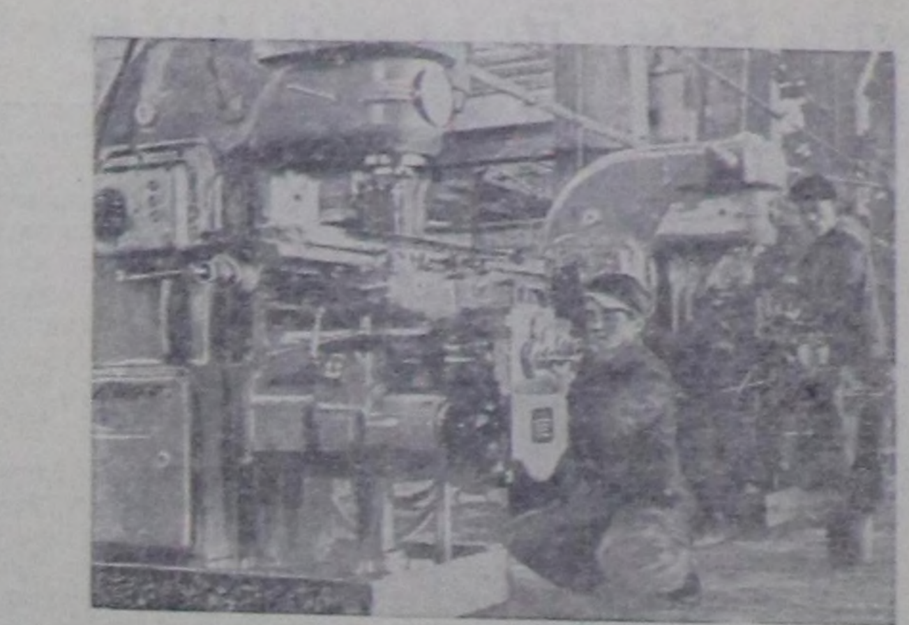
Кыдат Улус Республикасының машина тудушкун заводтары станоктар болган механизмдер бүдүрүштүкүн көөрдөшп, кымып турар машиналарын ас-сортиментини калбарып турар. Чурукта: Цицикарын машина тудушкун заводунуң (Сонгу-Чөөн Кыдатта) бүдүрүп үндүрген чаз вертикал-хошлагчы станоктары.