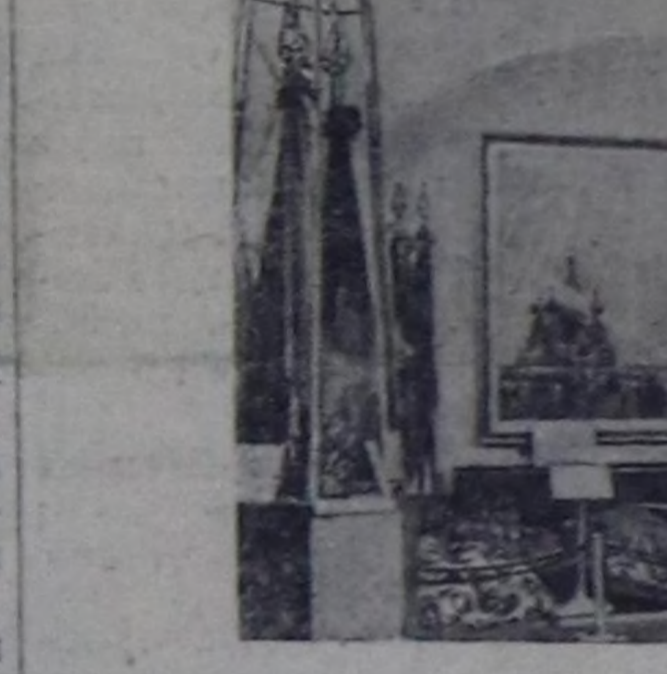
Москва. Гитлержи Германияның болгаш империалистг Японияга ууру (1941—1945 чылдарда) тулачушкуннага алдарың тылгеле-биле менчеге-жигитиң Совет Армияның келектериниң дайыңы туктары Совет Армияның Топ музейинде кадалганың чыдар.

Чурукта: Совет Армияның Топ музейиниң Тук залы.