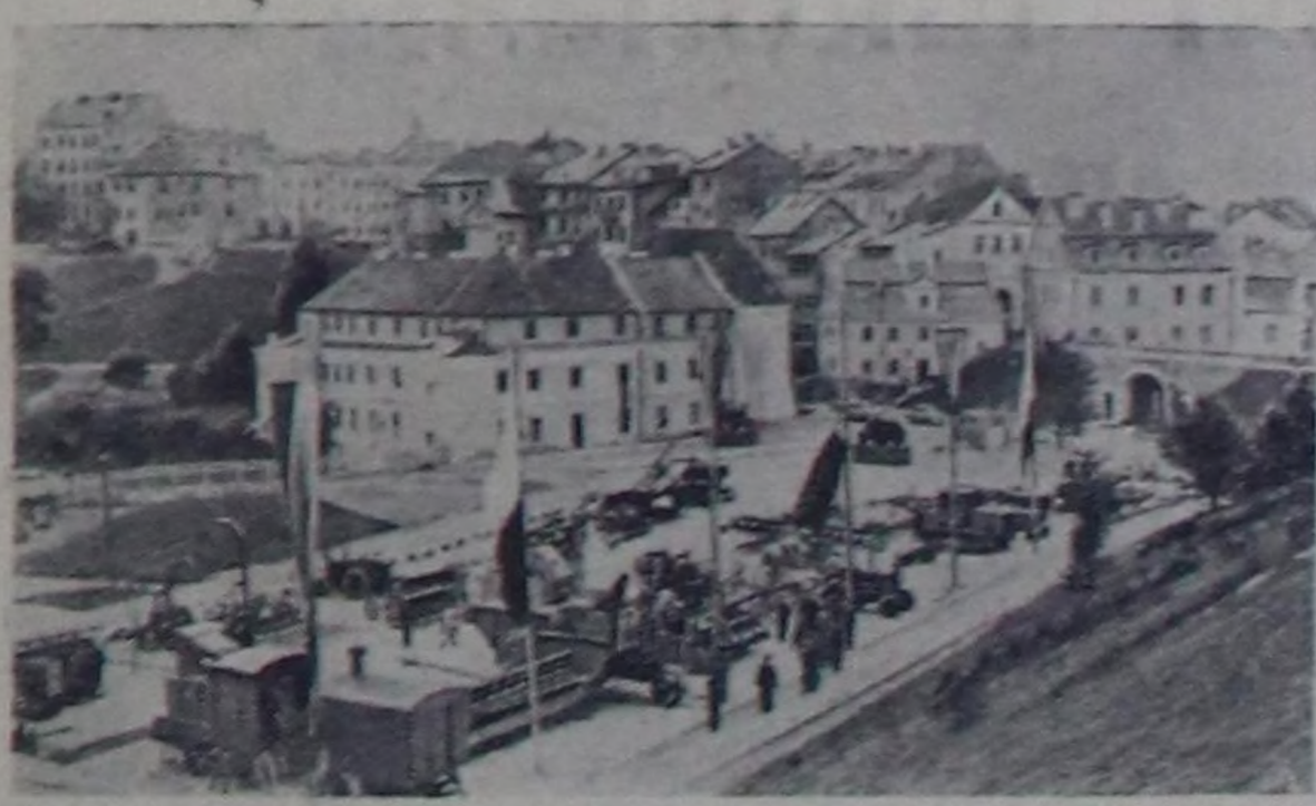
Польша Улус Республикасының 10 чыл өми таварыштыр Лублин хоорайга Польшаның өлкө ажал-агыйыны баргы топ белгелери ачиттырган. Улустуң өргө чыгарылышы чыгарында польша тараагынын чедикшиктерин мында чуулап турар. Чуурткы: өлкө ажал-агыйыны механизацияны павильонунун чыныда.