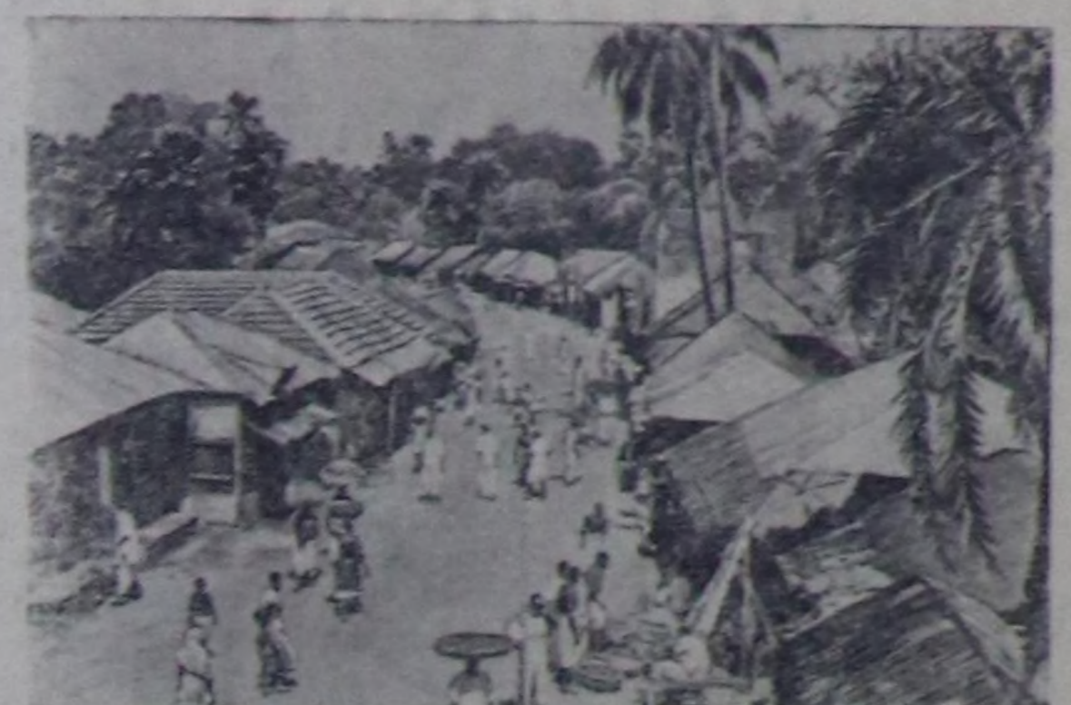
Индиянын Барыны Бенгалияда улус кедээ суурда садик курумчузу. Ол кедээ суур болза, Калкуттанан Бихар штатка бээр орутка түтүп турар.