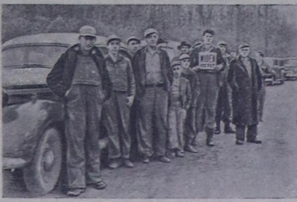
Америк ажалыңкы парлага американын Каттышкан Штаттарында үр үрүн дургузунда бозуп турар ажал совсалымкынынын демделген, ажал совсалымкыны кыланнар-беле эп-сөскө каттыжымкынын илеретип турар. Барын Вергия штатта турар Уиден деп хөмүр даш районунда шахтёрларын ажал совсалымкынын 1952 чылдын сентябрьда эгелеш. Дагжылар шахтаар-же шуртуп кирер чашаачы ескерилеринин эрттирбөс дөш оруктарга дүй туруп турарлар. Дагжылар, оларын өг-бүлелерин кезиктирени Уиденче ширеп автомобиль оруун ий чыл киреле хүнүңкы каларын турарлар.

Чуртукта: ажал совсалымкынын кылан дагжыларын болгон оларын ооддарынын Уиденче кирер орукут дүй туруп турары.