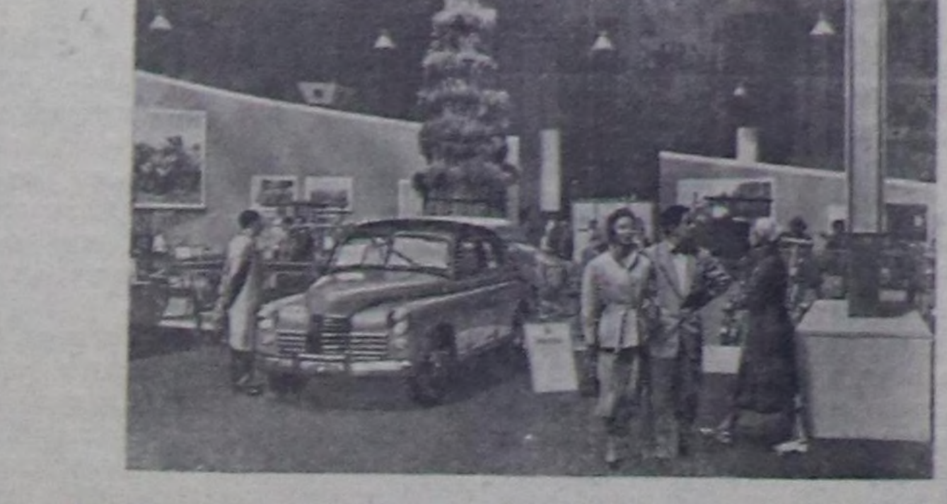
Дания. Чоокта чаз Копенгагенде «Форум» деп делегей бажынында ССР-нын улустур болган Көзгө азыл-агыл бугурадынын делегейин тургускан. Мында совет индустриянын күчүтү, совет азылдарыннын белг уран-шөвөр мергешин көргүзүп турар хей санын өспөнтаттарын дөргө салган. Чуртукта: делегей шийтирилээр.

үскөдөжиктин азылдарыннын тайныкты күштелерин турган заводтарын чамгы болган. Танылдар холдырында туттунуучу алган, заводтарын хаалгаларын чамгы азыл каш иччир-бе кылар турупканар. (СЭТА).