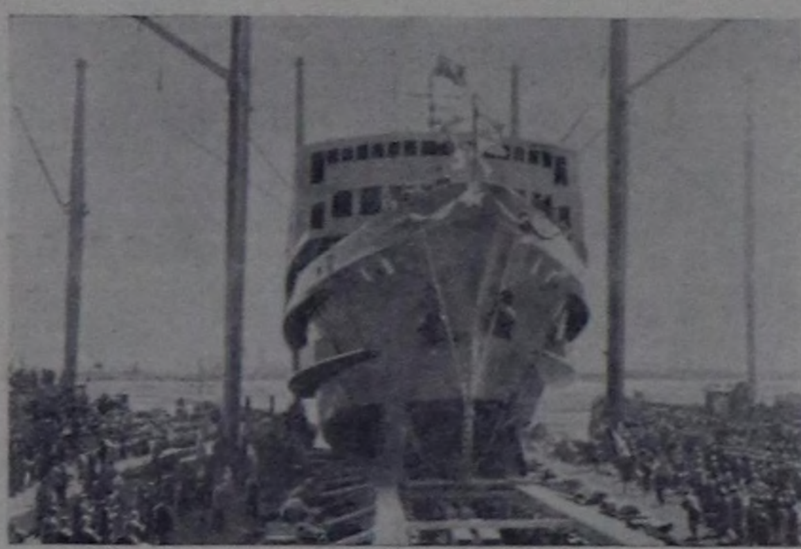
Чурукта: «Минчжун» деп пассажирлер олурар суднону сугже эжиндирип кирип турары.

ки хемеринге чоруур. Аңаа 974 кижжи олурар болгаш ол 350 тонна чүктү чүктээр. «Минчжун» болза, Шанхай биле Чунци аразына Янцзы хемге чоруур.