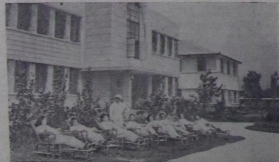
Кыдат Улус Республиканың профвилейдери ажылчы чоннарның каденың болгаш дыштанылганының дугайында улуг сагыш салышкыны кылып турар.

Чурукта: почта-телеграф ажилдакчыларының профвилелиниң саторийинде.