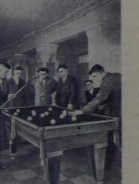
Сталинская область. Маринский районун Хрушев аттыг колхозунда чаа клуб туттунган. Ийн казгытг делгем бажында 350 олуттуг көрүкчүлөр залын, ийн киноаппараттыг киноу библиотекуны тургускан. Клубка колхозчулар биллиард, шыдыраа, даалы болгаш өске-даа оюнарны ойнап турар.

Билдиришкенин хүлээп алыры июль 31-ге чедир үргүлчүлээр. Август 1-ден эгелеп кирериниң экзаменнери эгелээр. (СЭТА).