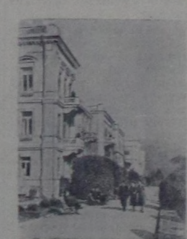
УССР-нин Крым областа. «Ливадия» деп санаторий. СЭТА-нын прессклишези.