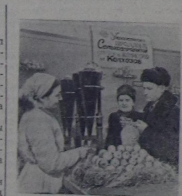
Колхозчулардан алдыгынн көдээ ажил-агы продуктуларынн садыглаарынн магазини Харьковта ажытыгын. Ол магазинден аңаа хоорайда колхоз рыноктарында тоо садыг майгыннарын тургускан. Чурукта: арага болгаш катчипи сатар магазин.