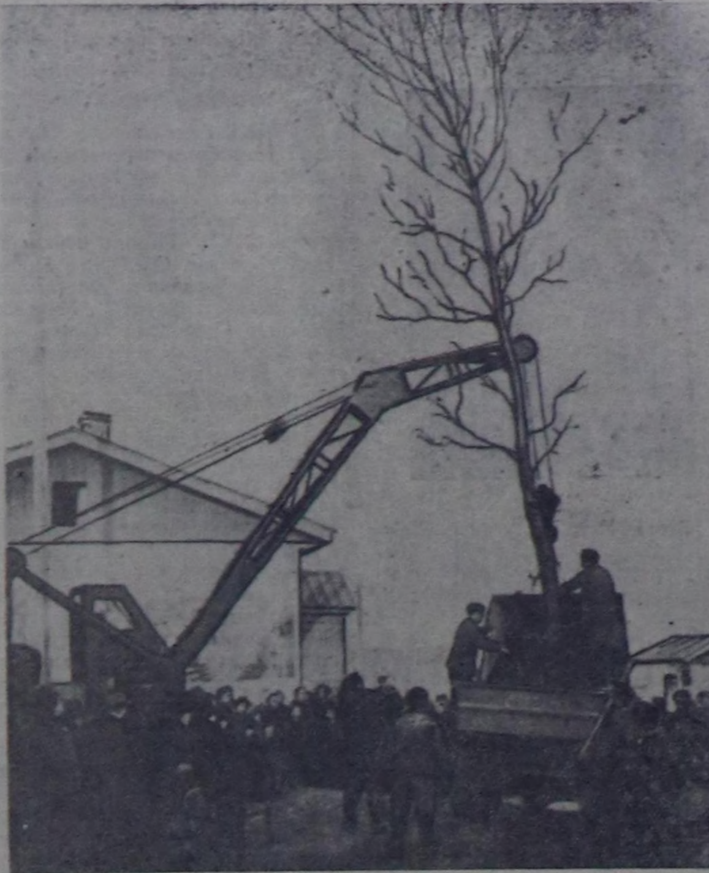
Коммунистг партия болгаш Совет чазак Кызыл хоорайның чаагайжылдыгыга чылдың-на чар. Хоорай ногаанчылдыгыңа чылдың Ленин, Кочетов болгаш ыяштарны болгаш 42.000 дөс Чурукта: Октябрь кудумчузу Совет чазак Кызыл хоорайның хэй хөрөнгини үндүрүп берип турар. 286000 рубльди төзөвилээн. Бо Найрал кудумчуларыңа 17.700 аканың олурткан турар. Ила азы олуртпазы. Чуруу С. Феоктистовту.