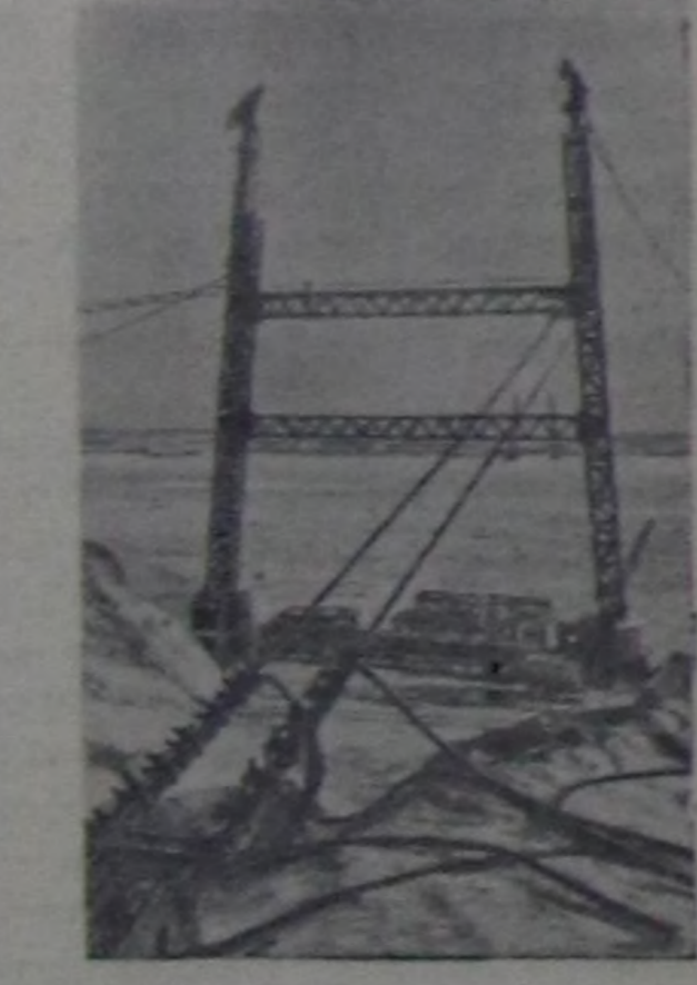
Сталинградгидрострой. Сталинград ГЭС-тиң тудушкунуунуң районунда аксылыг канат орукту тудуп турар. Ол оруктап бетон заводтарына болгаш кол гидротудуунуң онгарларына баар даштары болгаш элеваторны сөөртүр. Волганың эринде аксылыг оруктуң демир баганалары тургузуп турар, оларның узуну 132 метр болур.

Чурукта: Волганың оң талакы эринде демир баганалар. СЭТА-ның прессклишези.