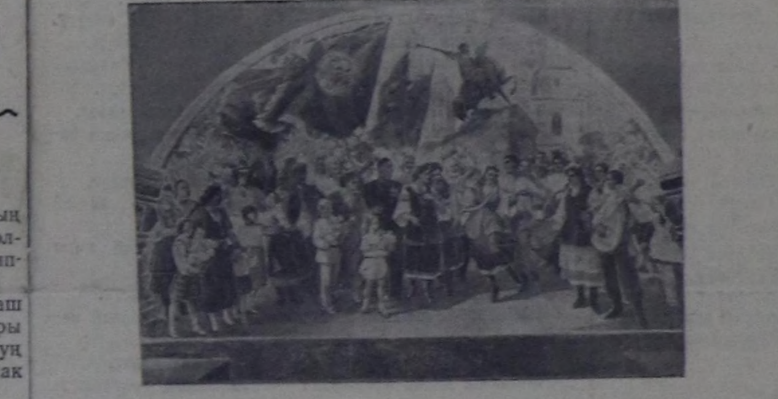
Москваның Л. М. Каганович аттыг метрополитенниң улуг дээр-бээ тутчу берген. Сөөлгү участок ажилдагы кирип турар. Чурукта: улуг дээрбектин унунда «Киевская-кольцевая» деп чаа станциянының вестибулон каастап шимзэн, Украинаның Россия-биле катап каттышканының 300 чылынга алдар болдурган панно.