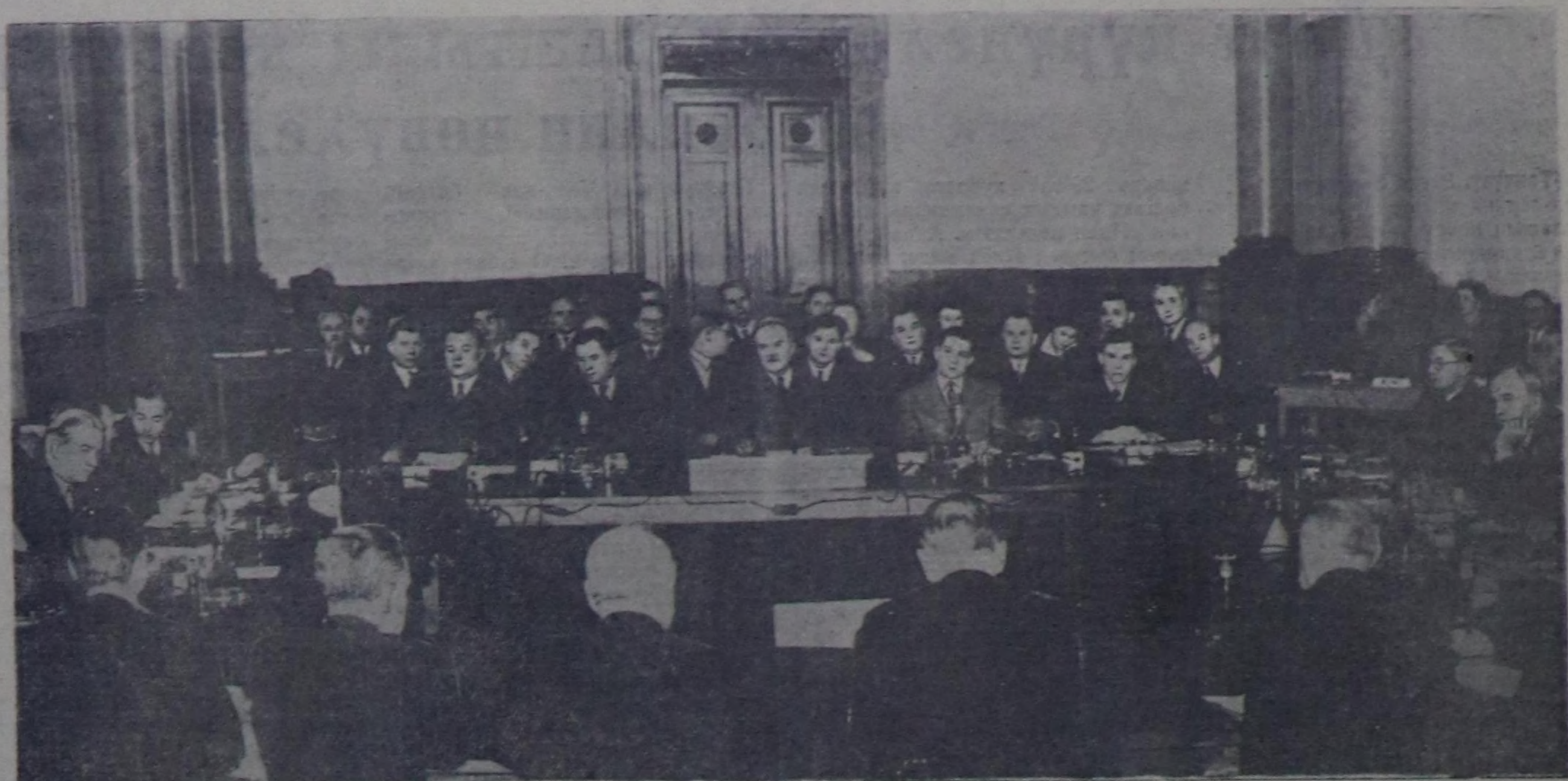
ССРЭ-нин, Франциянын, Англиянын болгаш АКШ-тын даштыкы херектер министрлеринин Берлин чөвүлел хуралында. Чурукта: оң талазында—АКШ-тин Даштыкы херектер министри В. М. Молотов, СССРЭ-нин Даштыкы херектер министри Я. А. Малик, Солагай Чуруу В. Савостьяновтуу.